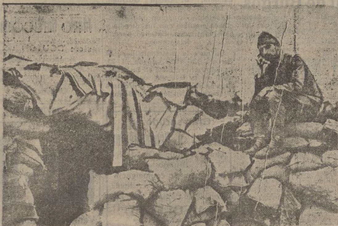
Un abrigo de las fuerzas nacionales en Navafria (Guadarrama) con teléfono y todo