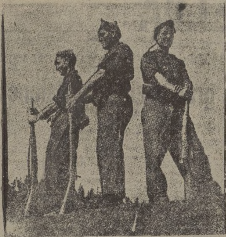
Falangistas, vigilando una posición del Guadarrama.