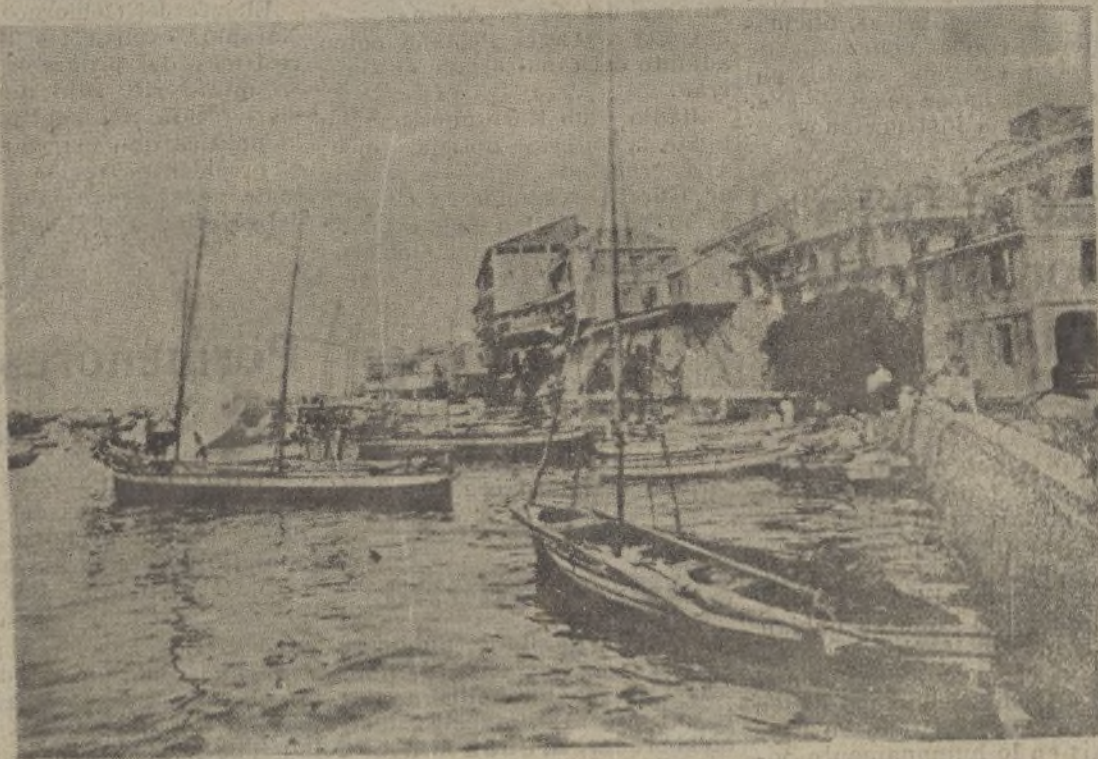
PANAMÁ.—Un rincón de la bahía (Rampa del Mercado)

MADRID.—El Comité Obrero de la Compañía de Tranvías Eléctricos ha publicado un manifiesto en el que se desmiente que hayan producido divergencias a causa de la revisión de los billetes gratuitos en los tranvías de Madrid. Agrega que tales billetes representan para la Compañía un perjuicio diario de millones de pesetas.