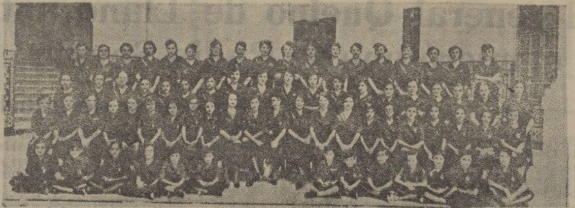
La sección femenina de Falange Española de Cadiz

En cambio los comerciantes del centro de la población parecen que no se han enterado, o no quieren enterarse, de que esta Delegación a mi cargo está dispuesta a evitar el fraude pa-