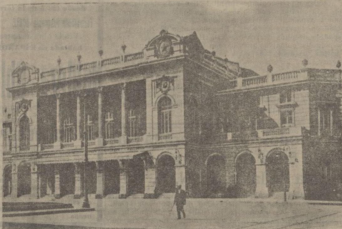
Santiago de Chile.-Teatro Municipal

EL BOXEADOR.—No, señor; donde lo recibí fué en la cabeza.