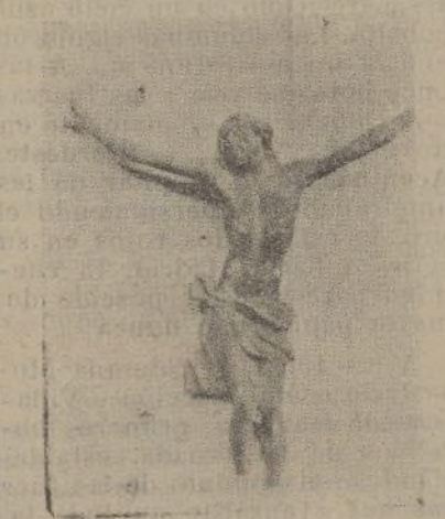
De la parroquia de la Concepción, alegre como rayo de sol y blanca como una paloma, ha quedado este Cristo sin cruz y entre escombros

El Sagrado Corazón, convertido en granero, ahumado, las paredes profanadas con letreos soviéticos: «La Religión es el opio...»; la campana, testigo tirado y mudo al pie de la escalinata de la iglesia. ¿Cómo se las compondrían los bárbaros que lo hicieron? La construcción intacta.