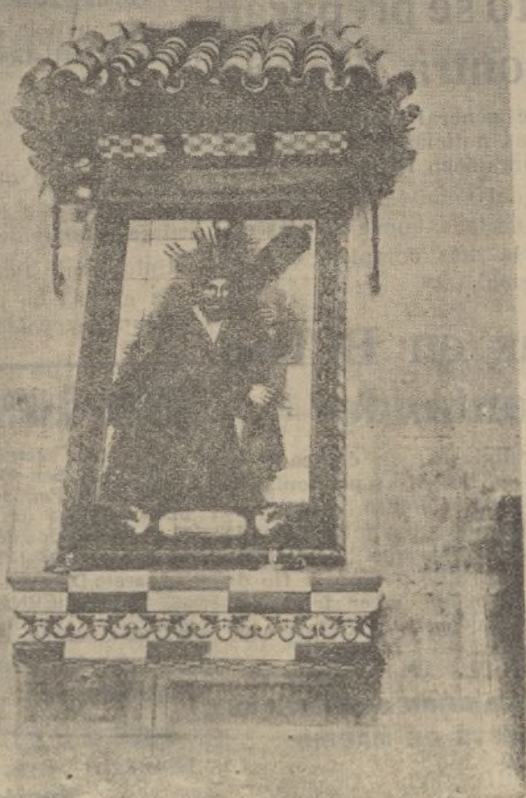
El Nazareno de los Azulejos, respetado por las llamas; ni el humo se atrevió a la Sagrada Efigie

En Madrid, los nuevos reclutas dejan ver el completo estado de desorganización de la ciudad. A pesar de los esfuerzos del Gobierno, los milicianos se niegan a salir para el frente de combate exigiendo la seguridad de que volverán victoriosos.