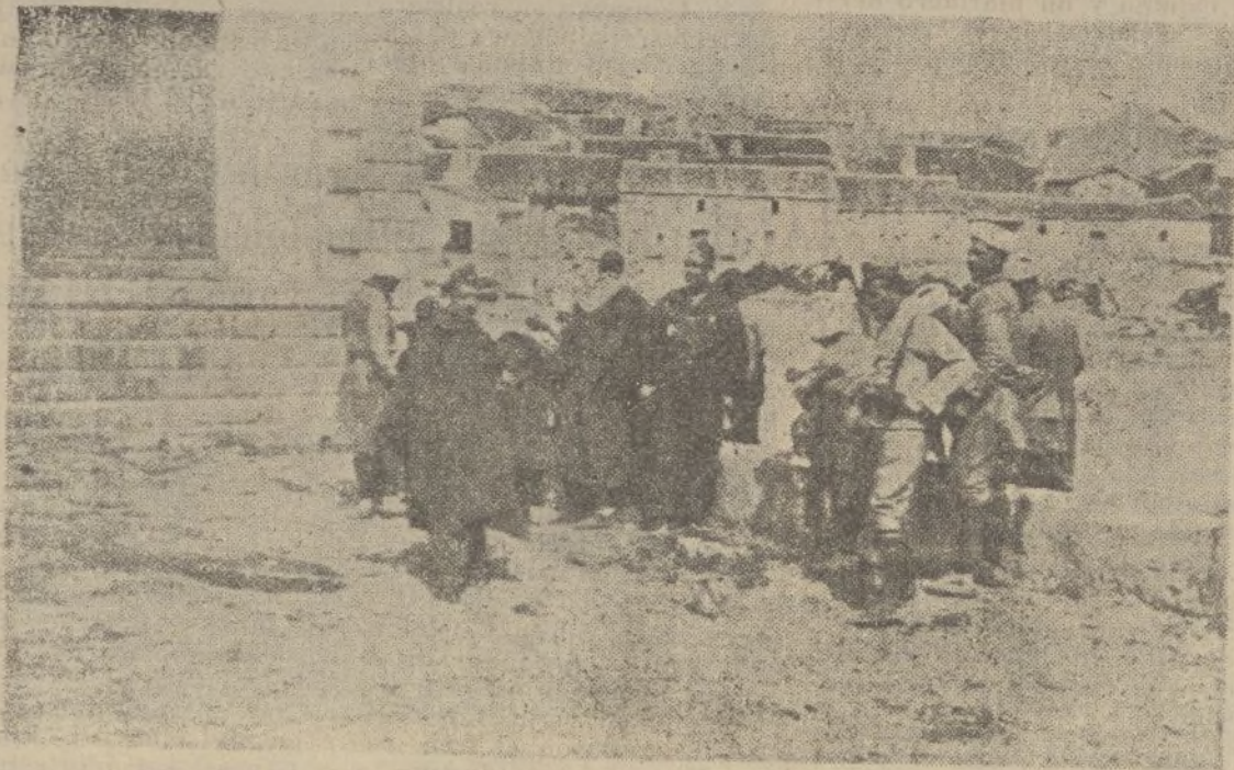
Soldados de Regulares sacrificando reyes para su comida