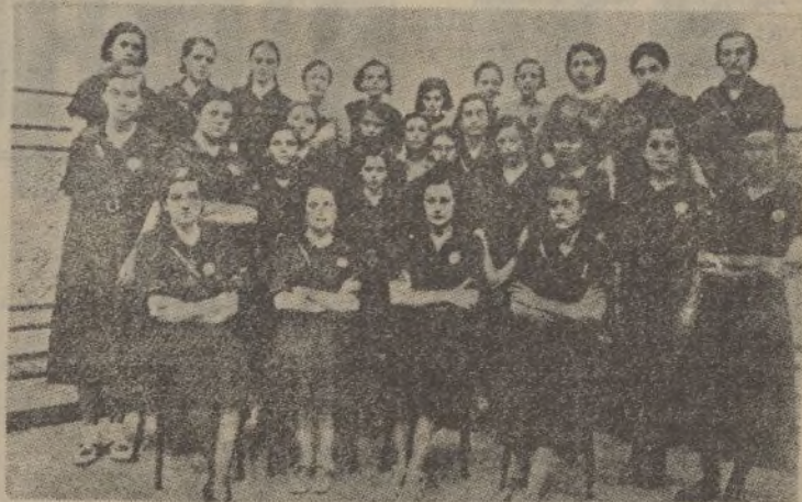
Un grupo de bellas y patrióticas falangistas cordobesas.