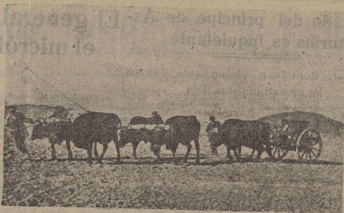
Cómo se realiza el traslado de nuestra Artillería de montaña para su emplazamiento en las nuevas posiciones tomadas al enemigo.