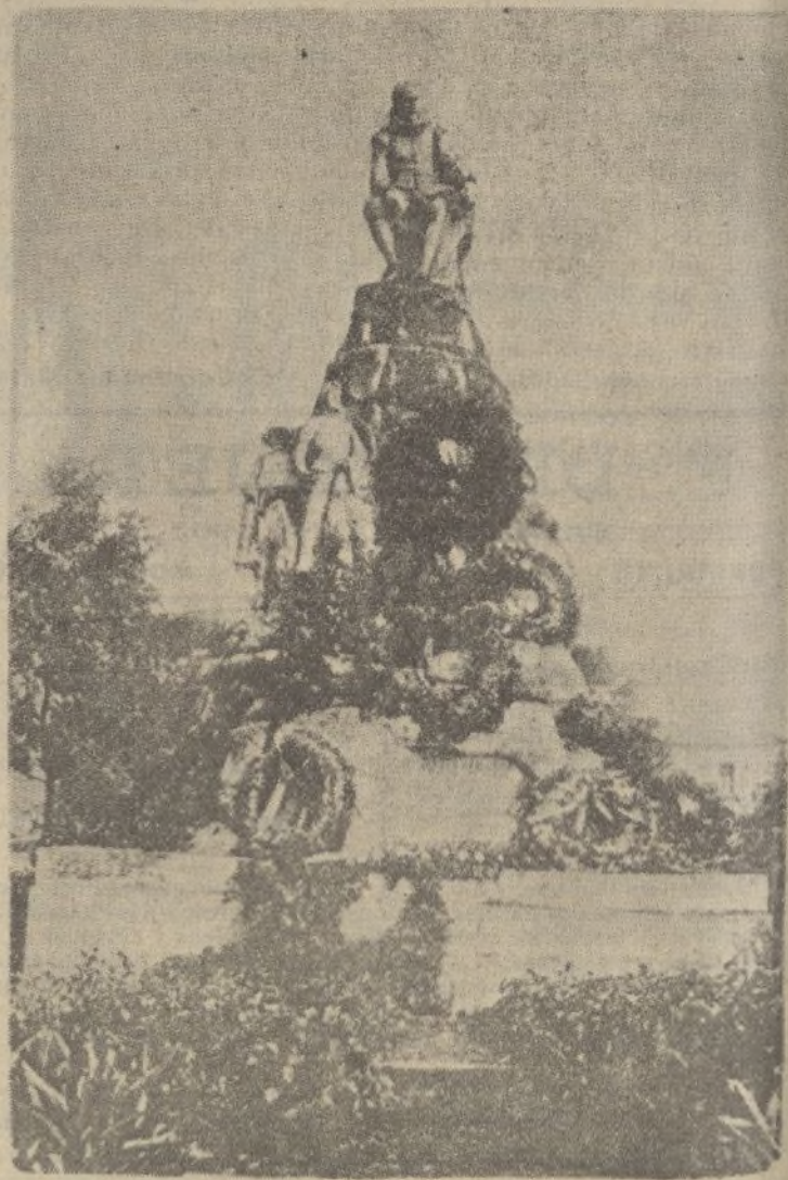
PANAMÁ. Monumento a Cervantes