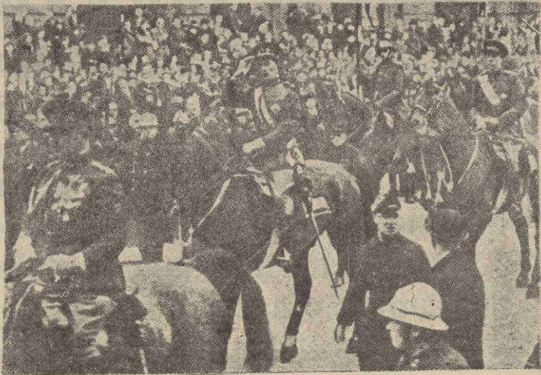
Leopoldo III, rey de Bélgica, al frente de sus tropas.