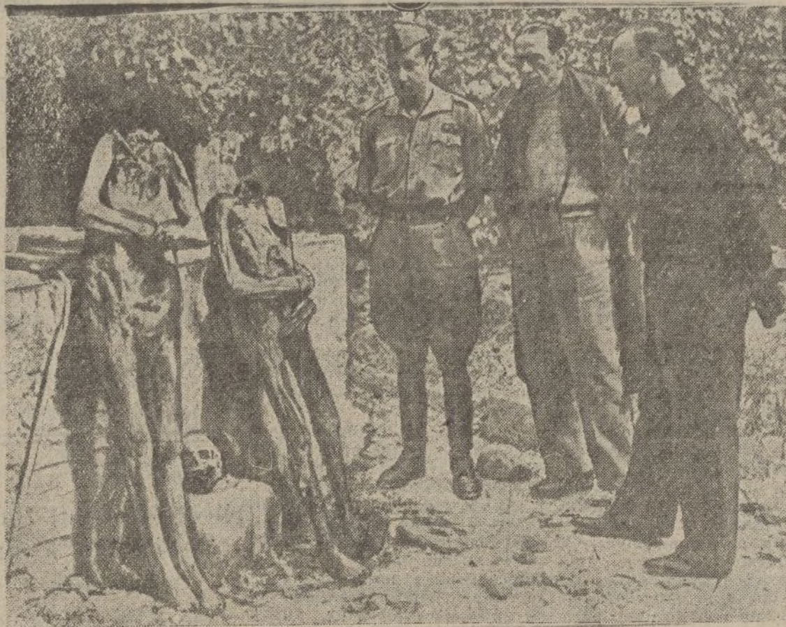
Los marxistas, sanguinarios y feroces, no solo se limitaron en Toledo a destruir monumentos y obras de arte y a asesinar personas, sino que violaron las sepulturas de los templos, sacando los cadáveres —La presente fotografía muestra dos cuerpos momificados que los rojos expusieron en una plaza de Toledo, ofreciendo un cruel y macabro espectáculo

A todos nuestros cordialísimos sentimientos y la seguridad de nuestra identificación con su dolor irremediable. Para el muerto glorioso, una oración a Dios por su alma llena de bondad y de abnegación, como corresponde a un caballero marino español.