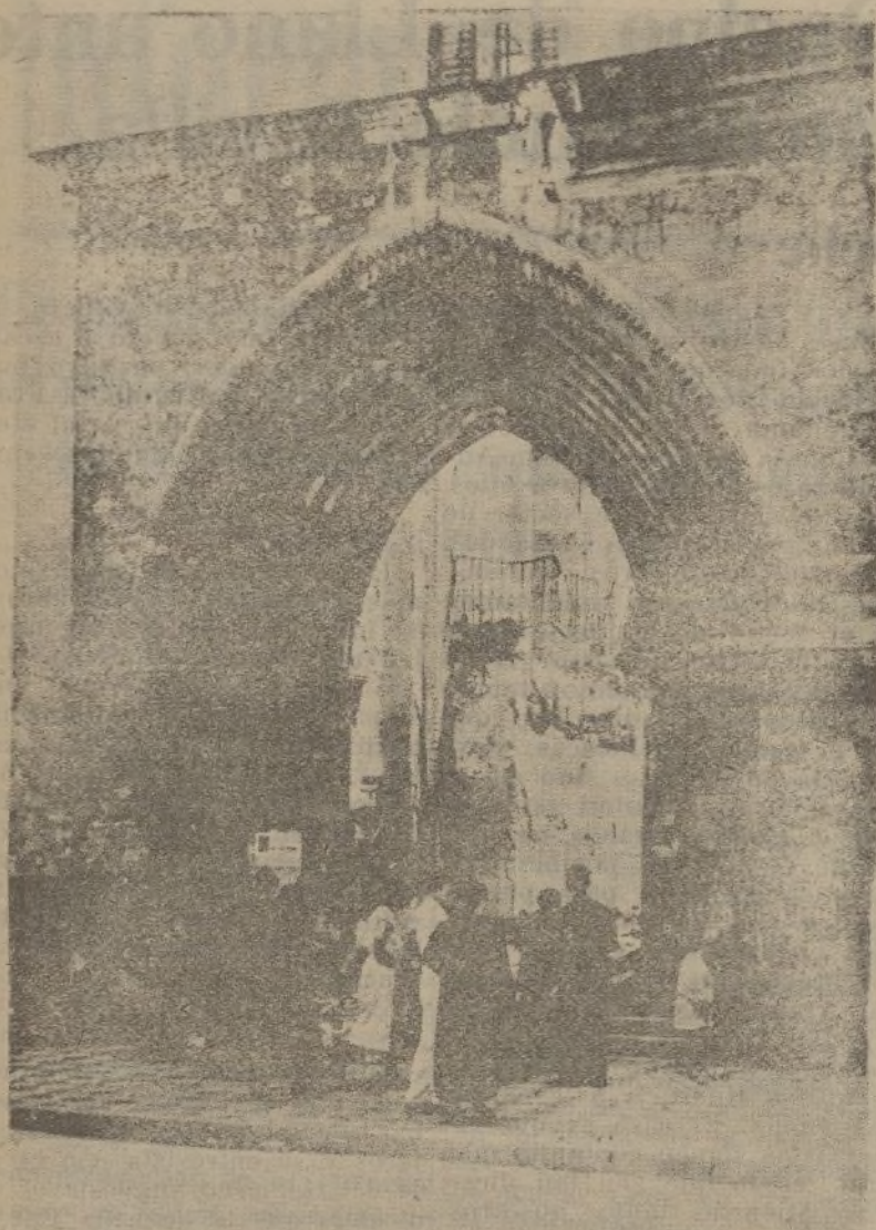
SEVILLA — Pórtico de la Iglesia Omnium Sanctorum, desde cuyo interior se observan los grandes destrozos causados por los rojos en su furia iconoclasta.