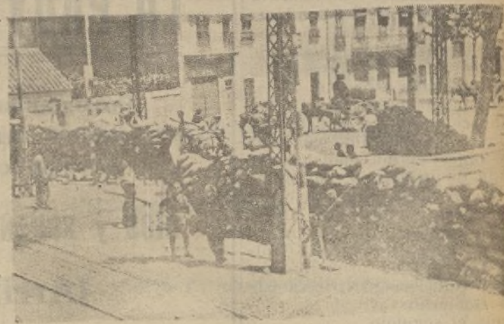
Parapetos en las calles de Valencia, levantado por los rojos. ¡D: poco ha de servirles.