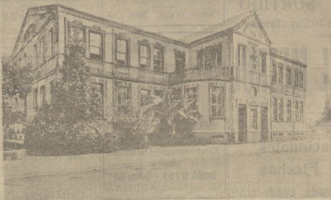
PANAMÁ.—Ciudad de Colón. Escuela Principal. Ayuntamiento de Madrid

MARSELLA.—Por las últimas noticias aquí recibidas de España se sabe que en Madrid el Gobierno de Largo Caballero procura despertar el valor de los milicianos, a los que acaba de incitar a conservar las posiciones y a no retroceder ni un metro aún a costa de sus vidas. Estas excitaciones, redactadas en términos inflamados, dejan a la población indiferente, pues los combatientes y los no combatientes saben lo que les espera.