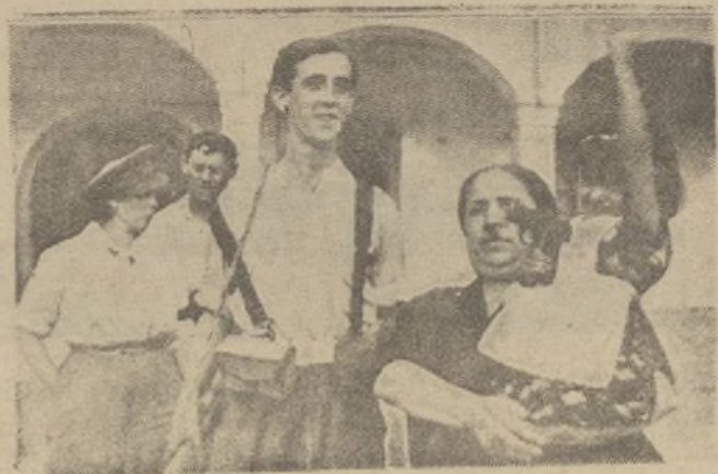
Una familia de los rojos, en el cuartel de la Montaña. La niña puño en alto y pistola en mano. ¡Desgraciados!