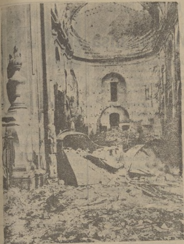
BARCELONA.—Interior de la iglesia de Belén, completamente destruida por los «cristianos» catalanistas.