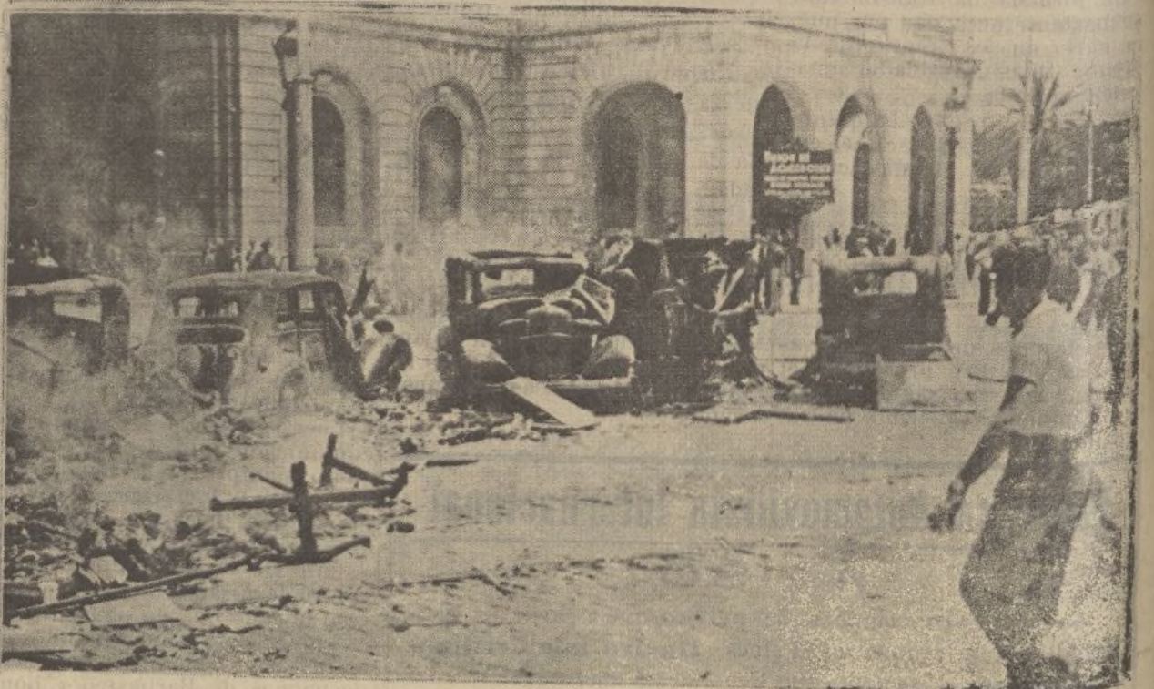
MADRID.—Destrozos causados por las bombas de la aviación nacional en un convoy de los rojos.