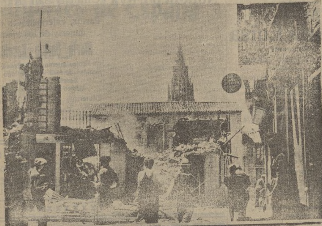
Las predicaciones de los «intelectuales» de la República llevan a sus aventajados y rojos discípulos a la destrucción de Toledo como prueba de respeto a la Belleza y el Arte