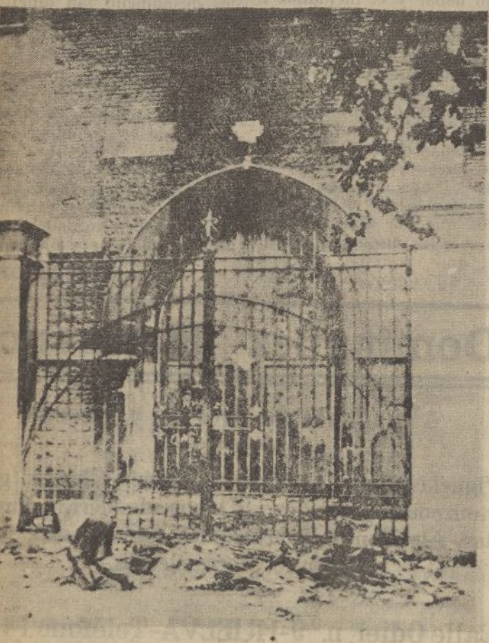
Barcelona.—Desván de la Iglesia Las Salesas, donde las turbas marxistas causaron los mayores destrozos

mas falsas sean esas informaciones, más llenan de alegría a los «leales». Y levantan —aunque ello parezca prodigioso— la moral de las heroicas «milicianas».