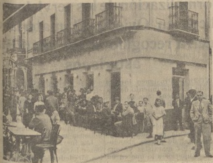
Huelva comenta en el café, en la calle, en todas partes con entusiasmo patriótico la entrada del glorioso Ejército Nacional en la Capital de España.