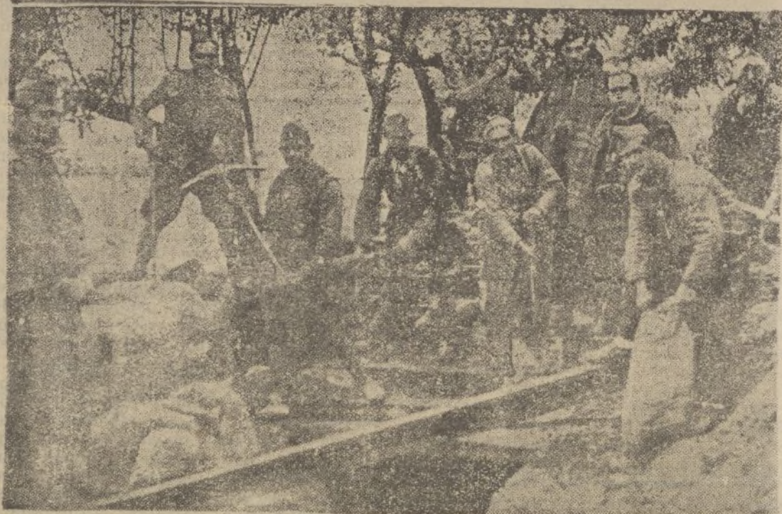
Nuestros soldados destruyen las famosas trincheras de las fuerzas del ge- neral Mangada y que abandonaron los rojos a presencia de nuestras tropas