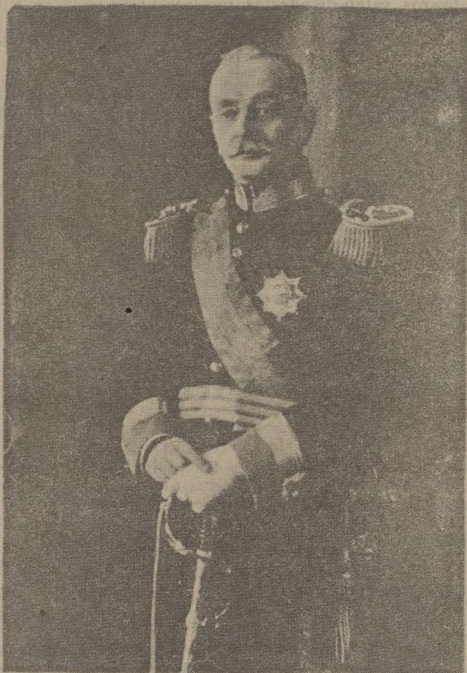
General Antonio Oscar de Fragoso Carmona

DIARIO DE HUELVA se honra Portuguesa y del Presidente en publicar en el día de hoy del Consejo, General Oscar Carlas fotografías de Su Excelencia mona y Doctor Oliveira Salazar, el Sr. Presidente de la República respectivamente.