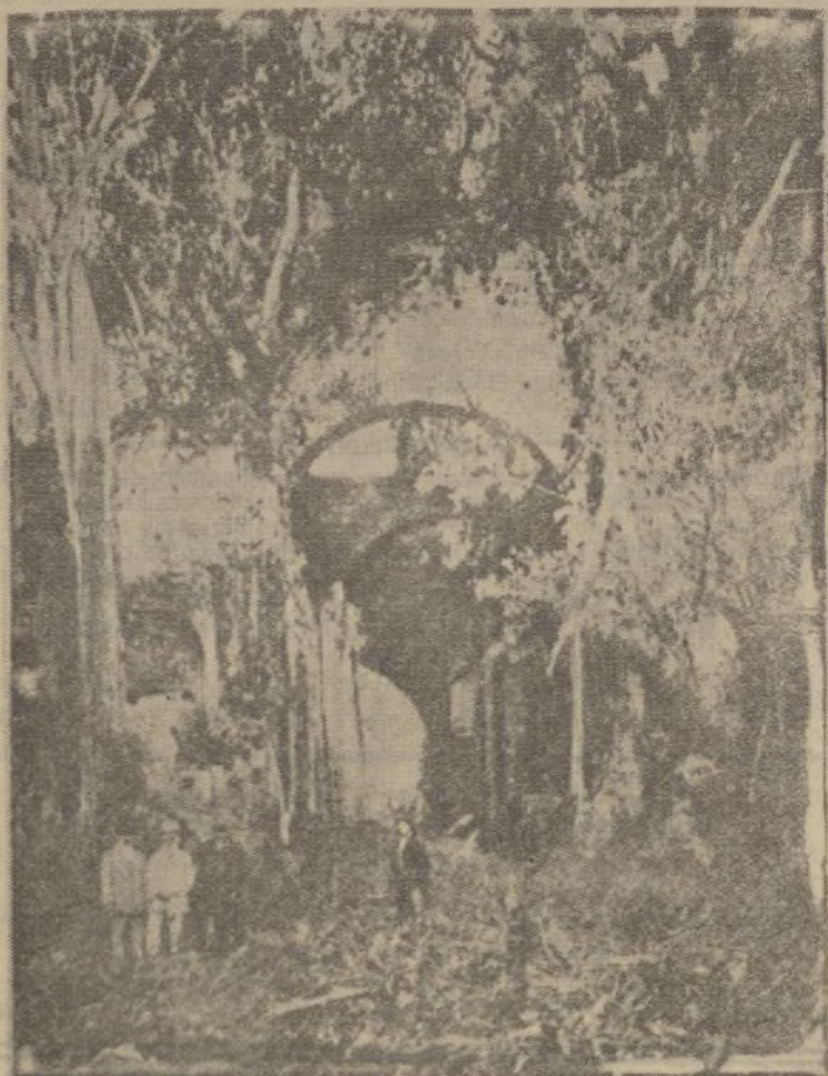
PANAMÁ.—Las viejas ruinas del templo de Santo Domingo.

Salida de Huelva . . . . . a las 15'30 Salida de Aracena . . . . . a las 7'45