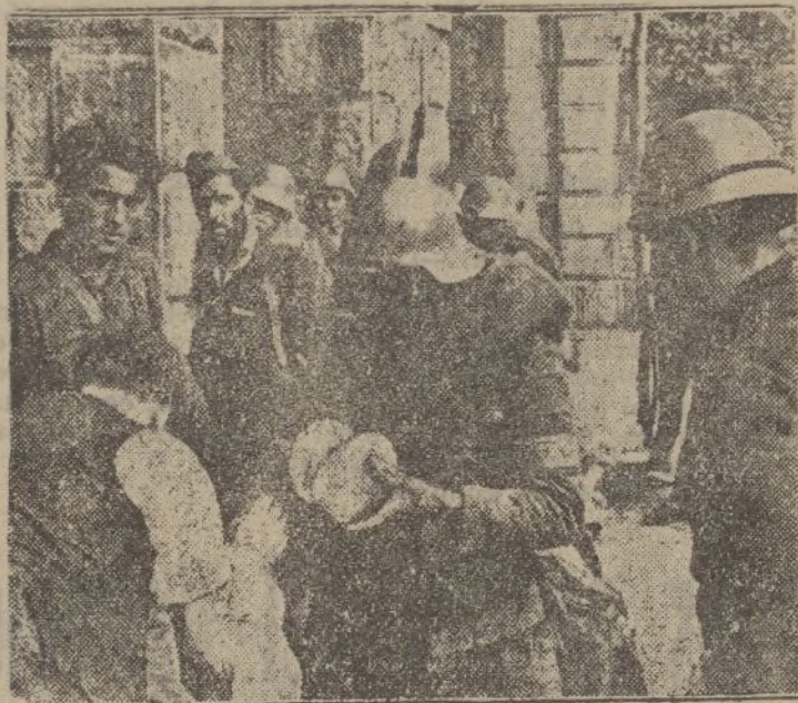
En Deva, puerto de Bilbao, los soldados nacionales reciben panes y otros artículos alimenticios antes de salir para el frente.