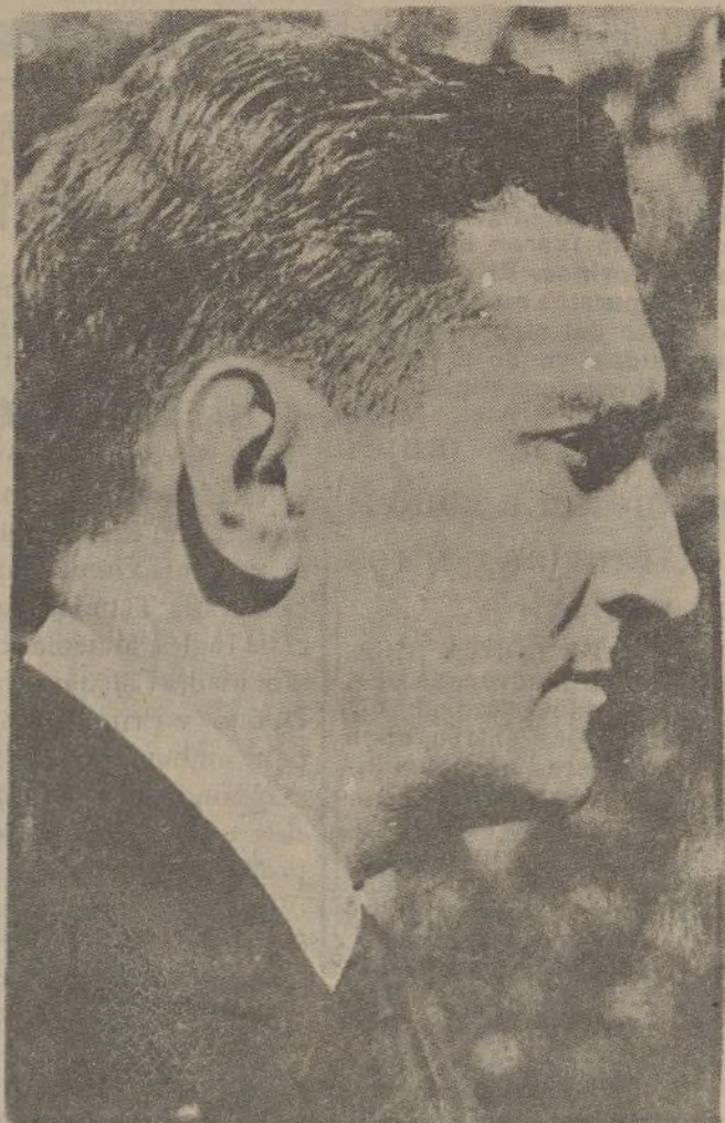
Dr. Antonio de Oliveira Salazar

Nació en Lisboa el 24 de Noviembre de 1869. Electo, por sufragio directo, Presidente de la República Portuguesa en 25 de Marzo de 1928, y reelegido en 17 de Febrero de 1935. Fué proclamado Jefe del Estado en 15 de abril del mismo año, y deberá ejercer su alto cargo hasta el día 15 de Abril de 1942.