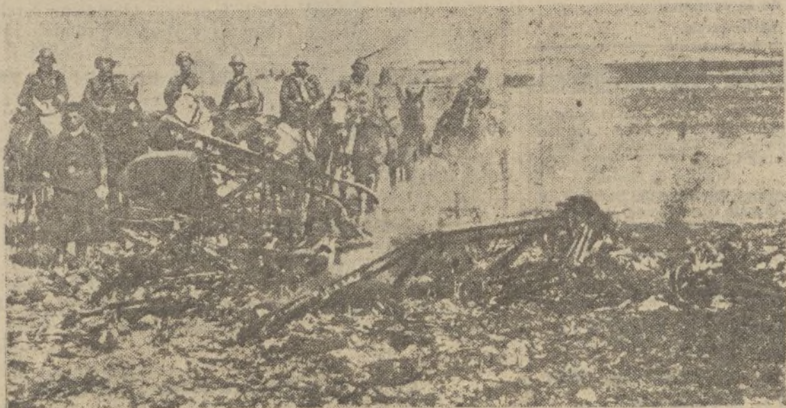
Aparato rojo destruido por nuestras tropas.