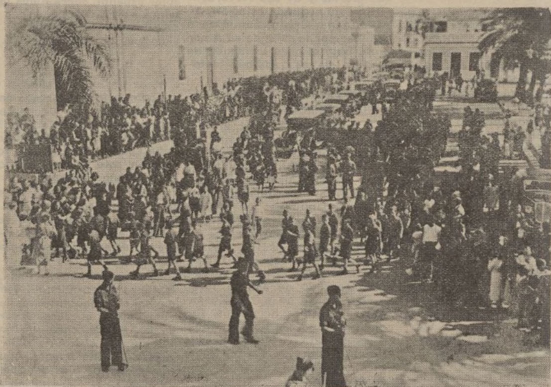
Un animado aspecto de la plaza de la Merced con motivo del desfile de fuerzas de Falange.

Los jefes y mandos de la J. O. N. S. se situaron en el escenario.