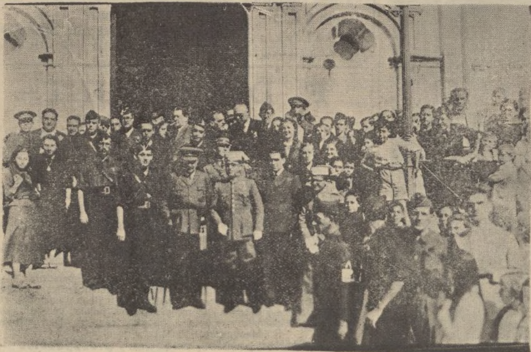
El gobernador civil y militar, don Gregorio de Haro, a su salida del templo de la Merced, después de asistir al acto religioso de ayer.