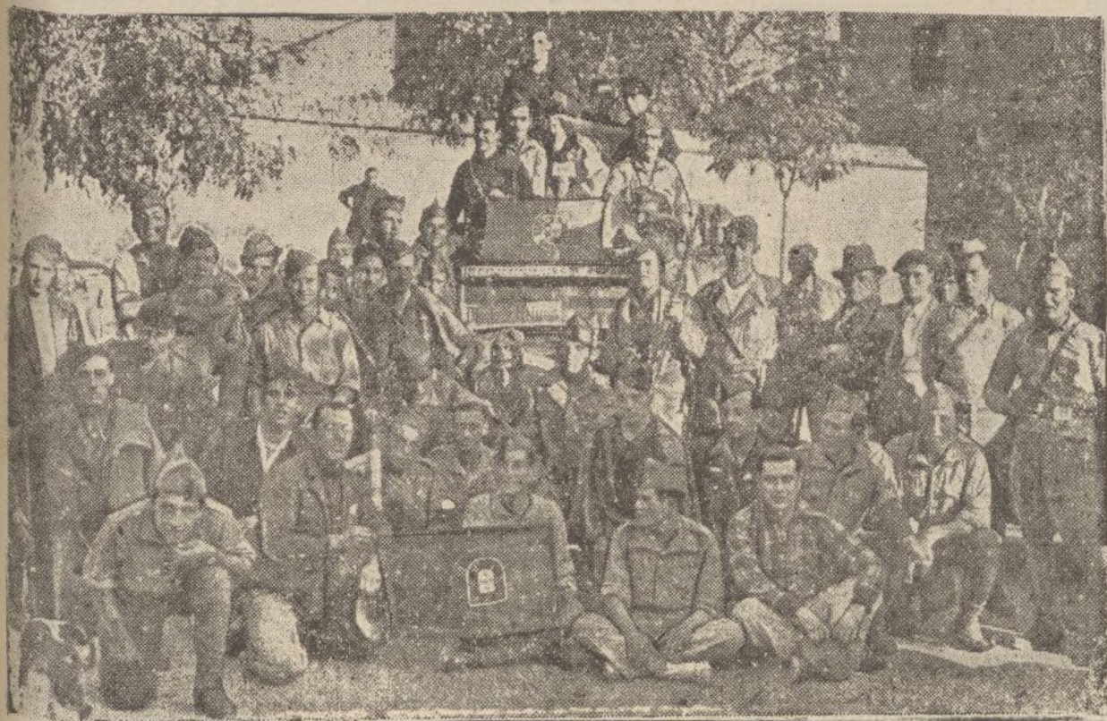
Grupo de portugueses de la legión extranjera.