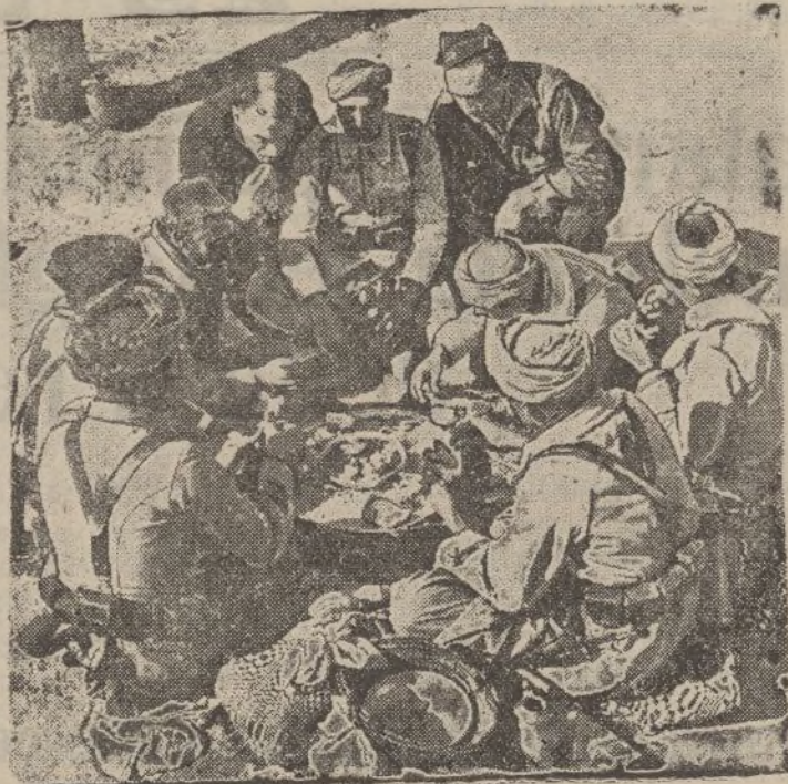
El almuerzo de los soldados moros en pleno campo de batalla.