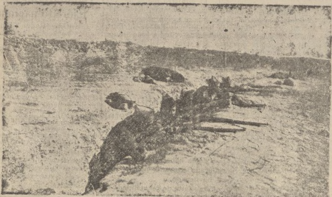
Las fuerzas nacionales ocupando en Navalcarnero una trinchera recién tomada a los rojos.