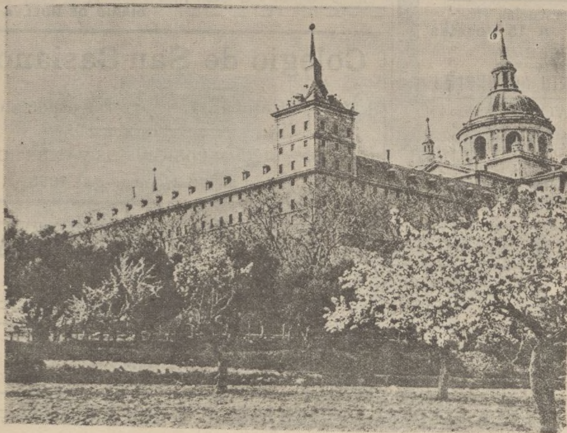
Real Monasterio de El Escorial, la octava maravilla del mundo

BERLIN.—La «Correspondencia Política y Diplomática», a propósito de España, escribe: «El reconocimiento moral de la lucha que el pueblo español ha empeñado por instinto de conservación contra el bolchevismo destructor, debería ser un hecho por parte de todos los Estados que quieran ser considerados naciones europeas civilizadas. La confirmación de la política de no intervención, prueba lo mal fundadas de ciertas sospechas y demuestra bajo qué punto de vista Alemania e Italia consideran los acontecimientos de España».