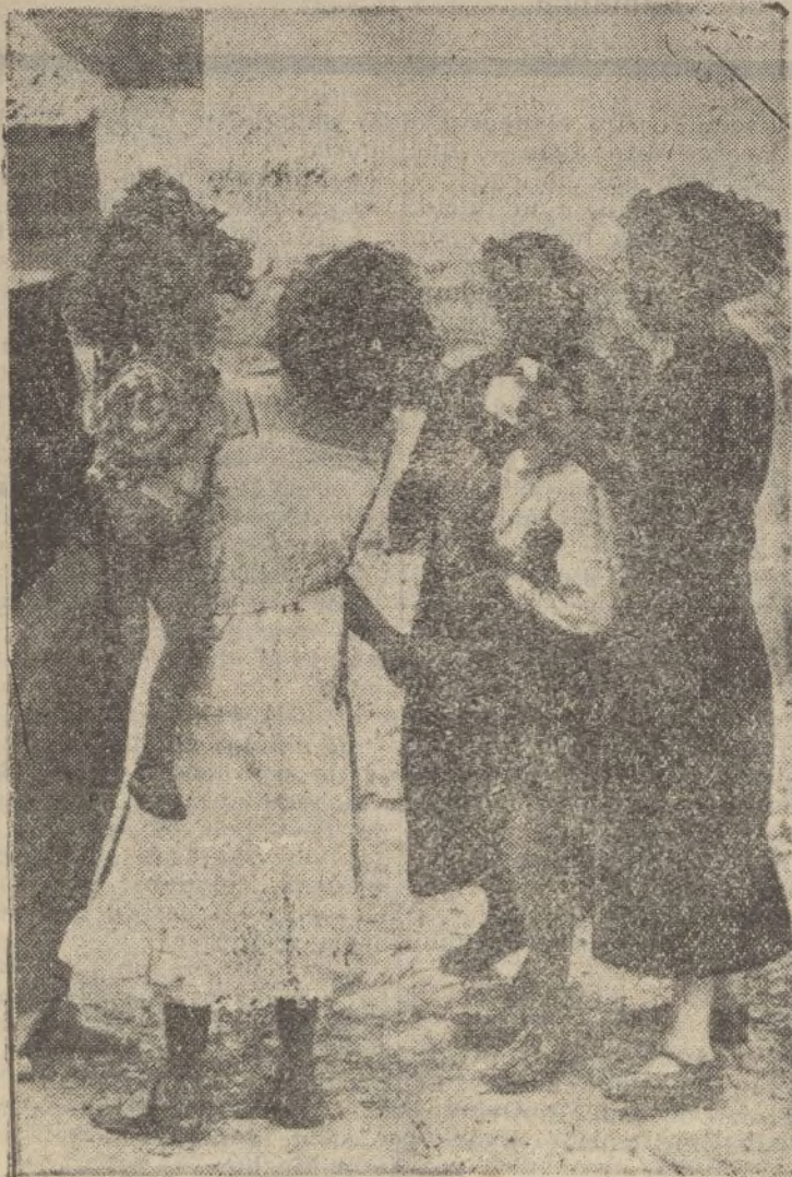
Cuando las fuerzas nacionales entraron en Palma del Río, mostraron las mujeres con lágrimas en los ojos a sus hijos, cuyos padres habían sido fusilados por los marxistas. Estos asesinaron en Palma del Río a 110 personas.