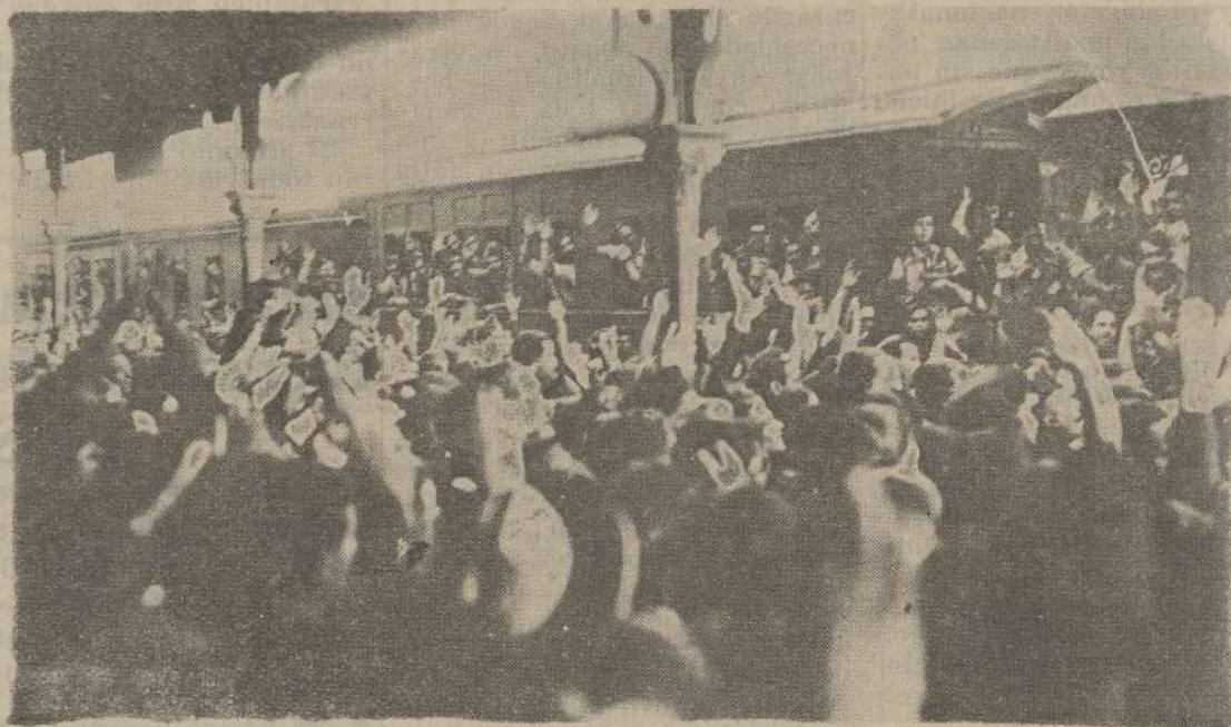
El momento de la partida fué de un entusiasmo indescriptible. Los vítores se sucedían, subiendo de punto la emoción patriótica.

El convoy se componía de doce coches—hubo que utilizar algunos de la Compañía de Zafra