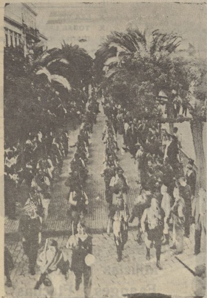
Desde su cuartel y hacia la estación de Sevilla, para tomar el tren que ha de conducirlos a dicha capital, las fuerzas de Falange atraviesan las calles con toda moralidad, siendo grandemente aclamadas.

Repetimos que pocas veces vimos a la muchedumbre enardecida por tanto entusiasmo patriótico.