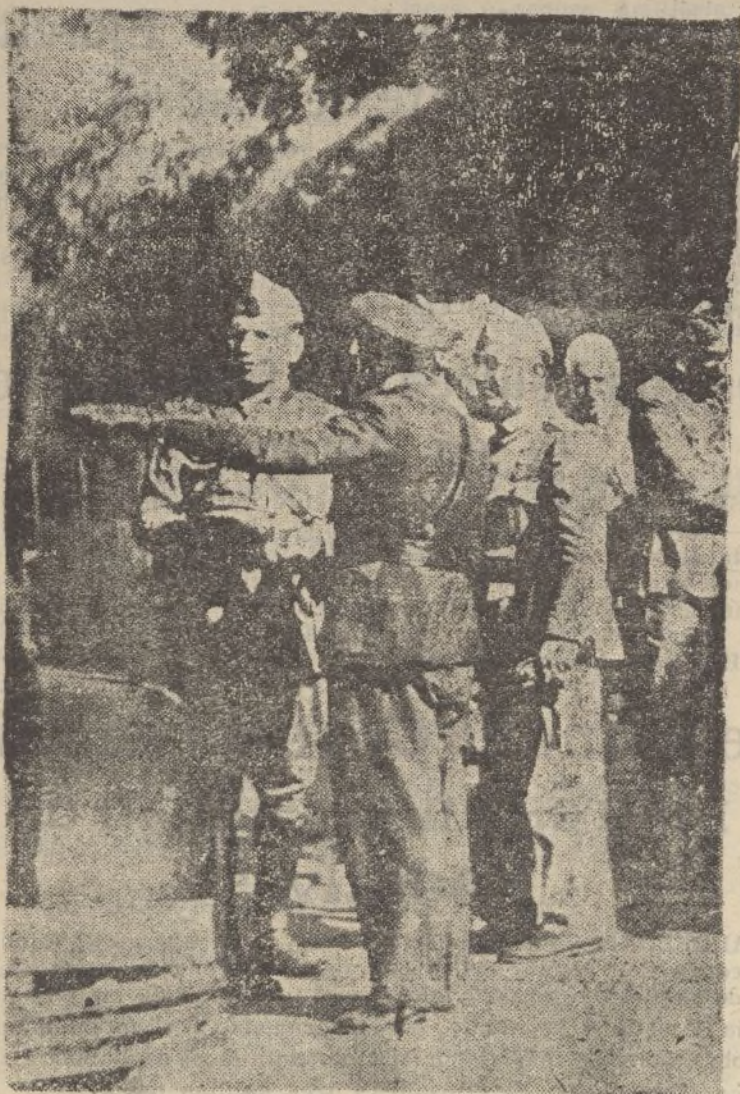
AVILA —El jefe del Estado, general Franco, a su llegada a esta capital