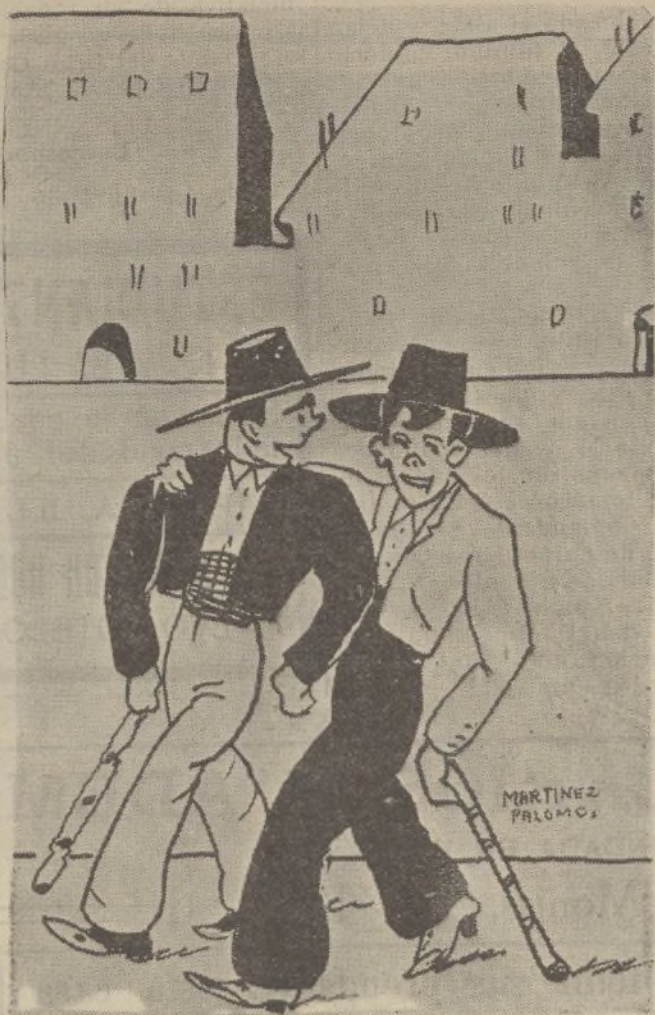
COMPADRERÍA, por Martínez Palomo.

—No sé qué va a ser de mí; er médico m'adicho que me voy a mori si no dejo er vino. ¡Me tie tan dominao? No te apures compare yo te acompaño en er sentimiento. Gracias Manué, acompañaame, pero pagas tú, que yo no tengo ni una chica.