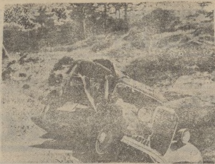
Un automóvil que en una carretera de Castilla la Vieja fue alcanzado por una bomba de aeroplano.