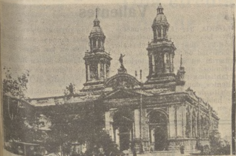
SANTIAGO DE CHILE.—La Catedral

Navalcarnero, a 30 kilómetros de Madrid.