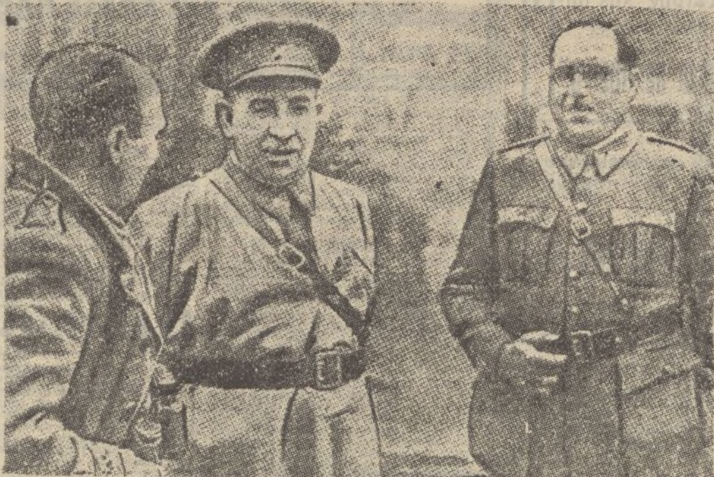
Después de la liberación de Oviedo, el coronel Alonso (a la izquierda) que manda una de las columnas que rompieron el cerco de la ciudad, y el general Orgaz (en el centro), Alto Comisario de España en Marruecos, con el general Aranda, que heroicamente defendió la ciudad.