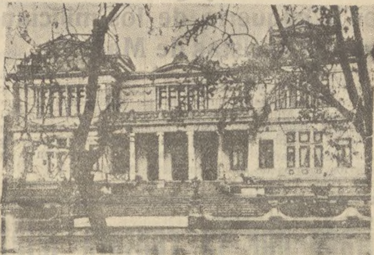
SANTIAGO DE CHILE.—Club de Viña del Mar

CORUNA.—Se sabe que el un general recién llegado de Moscú y la dirección de las milicias catalanas ha sido entregado a las autoridades rusas.