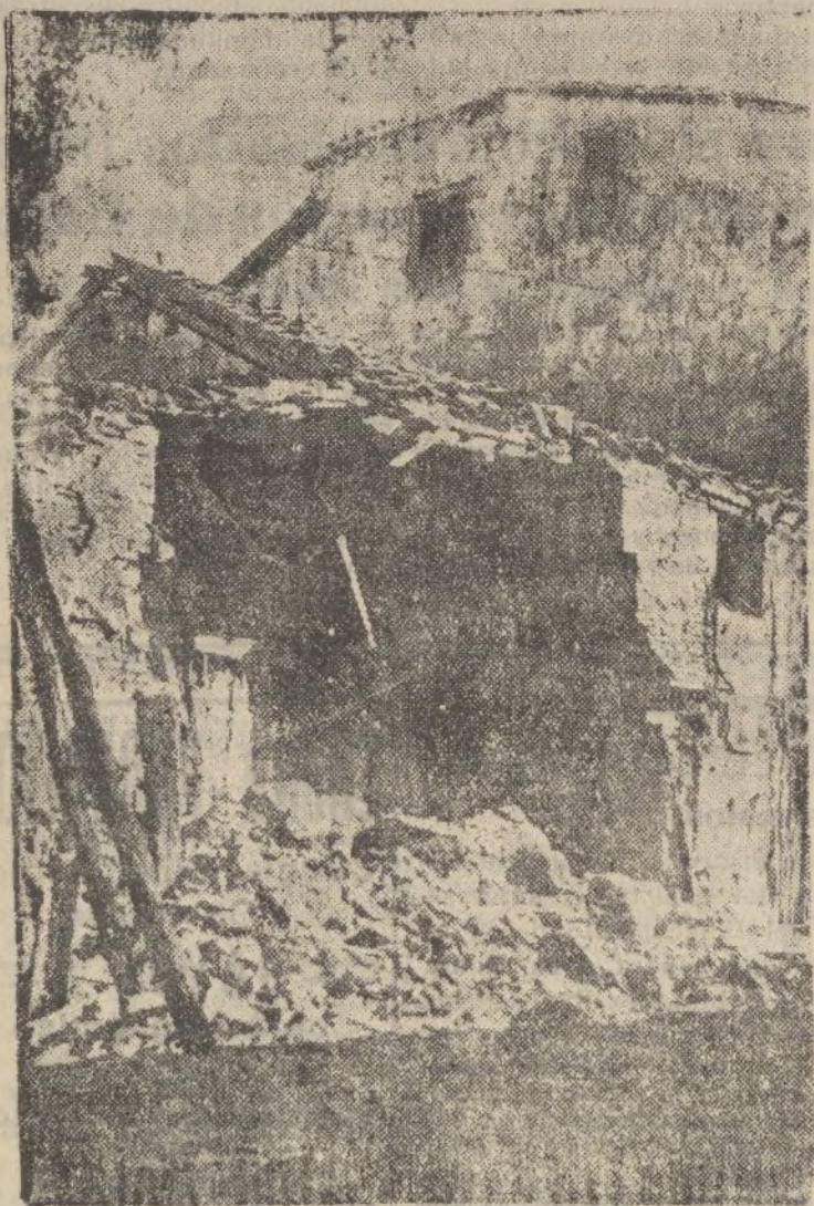
Lo que queda de una casa en Navacerrero, que fué disputada por los rojos y tropas nacionales.