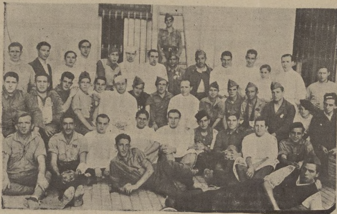
Con el personal facultativo del Hospital, fraternizan los soldados que sintieron rasgada su piel por las balas enemigas en defensa de Dios y de España