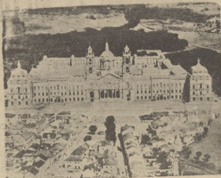
El soberbio monasterio de Mafra; el Escorial portugués.