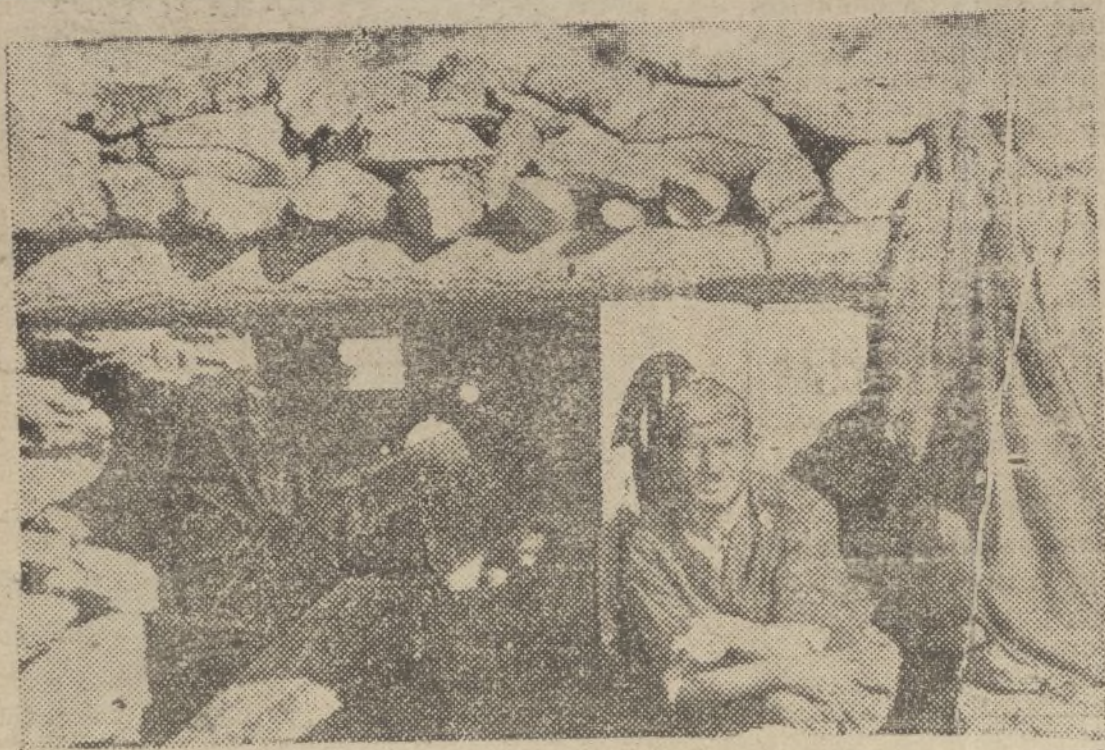
Una posición de Artillería en Navas Mardelqués Ayuntamiento de Madrid

El presente número consta de DIEZ páginas.