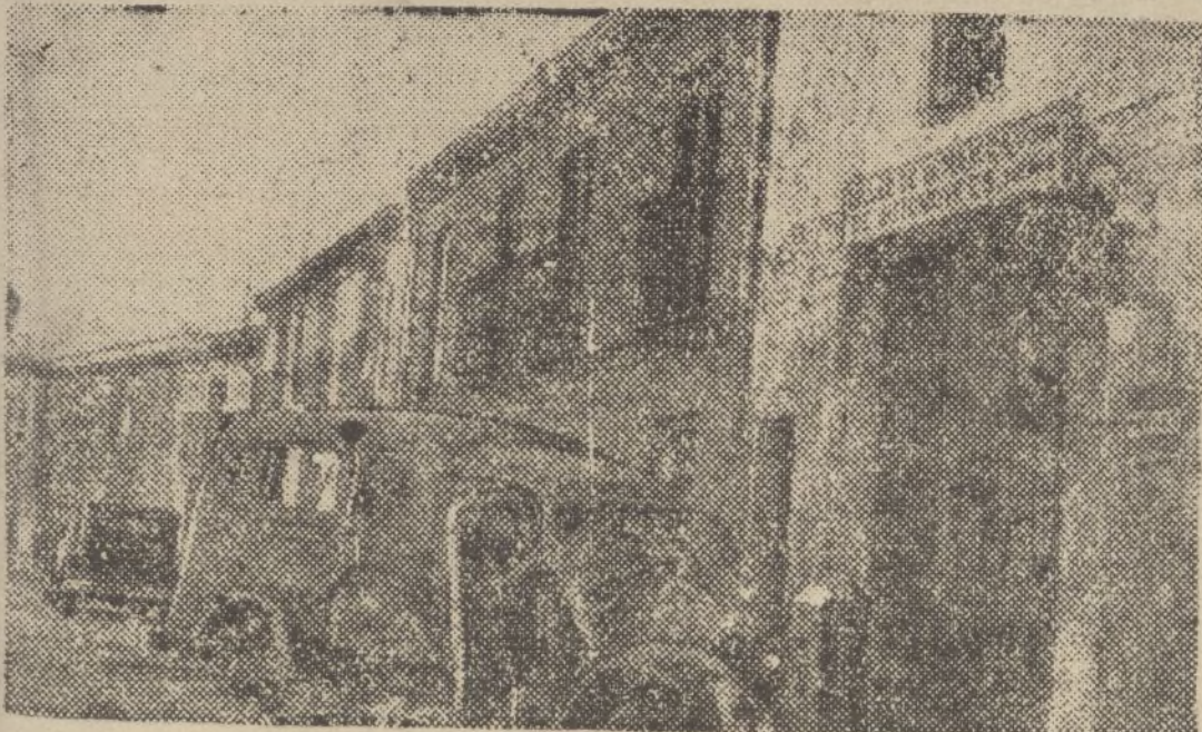
El aspecto que presentaban las fuerzas nacionales poco después de haber entrado allí