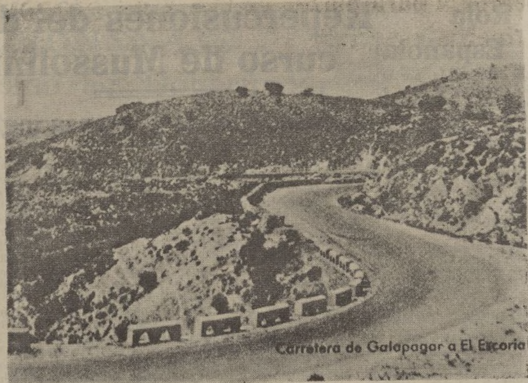
Carretera de Galapagar a El Escorial