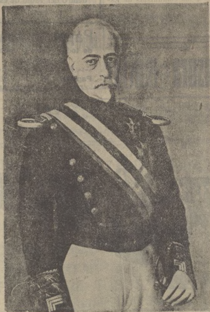
El Duque de Ahumada fundador del benemérito Cuerpo de la Guardia Civil