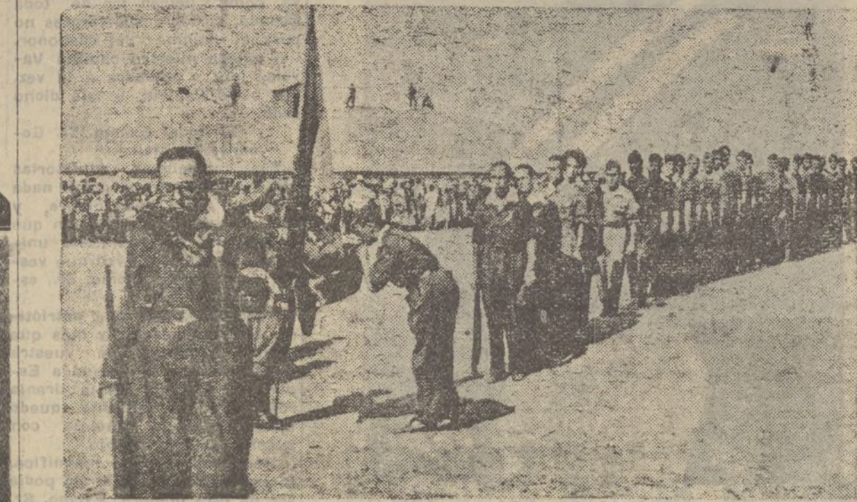
CADIZ.—Momento de jurar la bandera los milicianos.