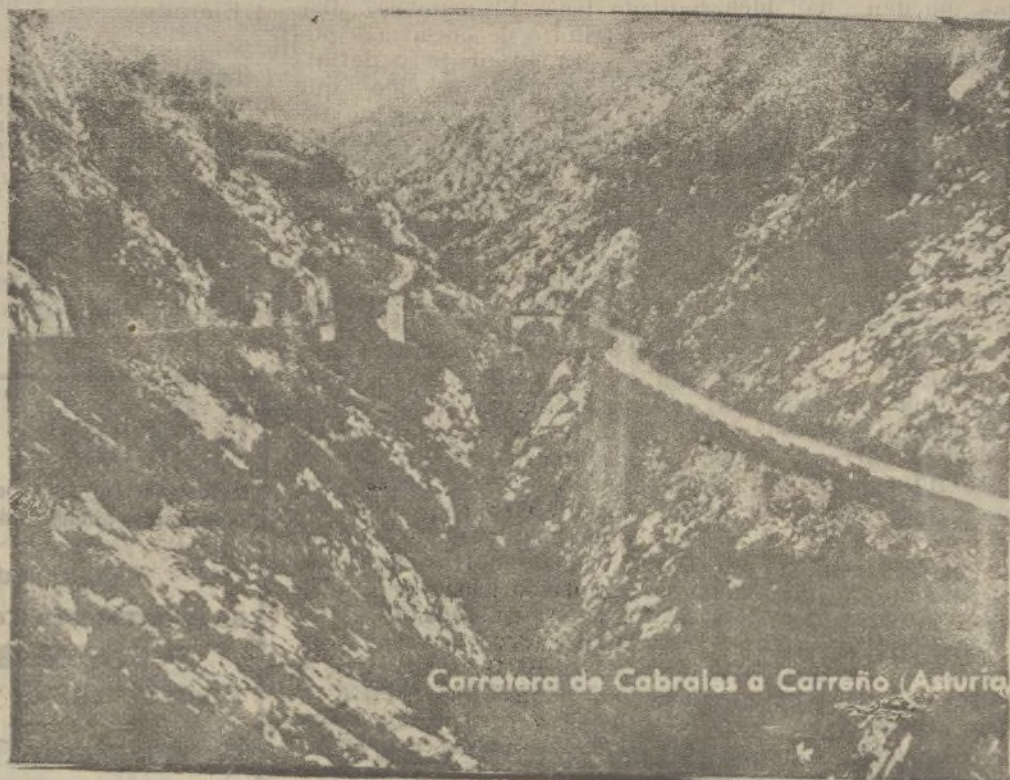
Carretera de Cibrales a Carreño (Asturias)