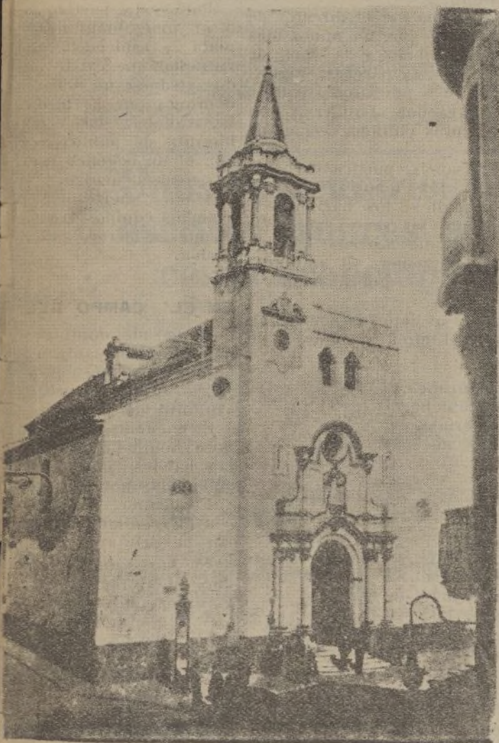
Iglesia de la Concepción

nos heles, justamente alarmados, se fueron antes de terminar la Misa. Los demás salimos por la Casa Rectoral, pues se había tomado la precaución de cerrar la puerta de la iglesia. Poco después era pasto de las llamas. Y ahora, después de tres meses, vuelvo a entrar en su recinto, todo desolación. «Por tierra derribados», deshechos, con sumidos por el fuego, yacen altares, imágenes y ornamentos. Se ve por todas partes la huella de la bestia. Unos obreros, hermanos de los agentes de tanta destrucción, realizan trabajos de desescombro, y el chocar de sus palas y el estridente ruido de los camiones de acarreo me recuerdan, por contraste, el dulce rumor de los rezos y el suave pisar de los zapatos femeninos. Pero entre tanta ruina, que oprime el ánimo, había de ha-