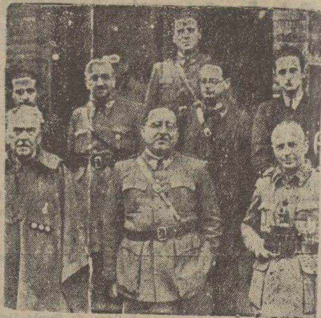
OVIEDO.—El general Aranda, con su Estado Mayor, organizadores de la resistencia en el cerco de la ciudad por las tropas marxistas.

Con el Gobierno rojo huido va el embajador ruso Rosenberg