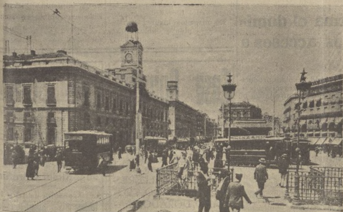
¡La Puerta del Sol! ¡El ministerio de la Gobernación, desde donde tantas veces se fragó la ruina del país y, últimamente, se intentó deshonrarle! Felizmente, pronto, Madrid entero, vibrante y patriótico, aclamará frenéticamente a las tropas vencedoras, mientras en el balcón principal flameará, orgullosa y significativa, la bandera bicolor de nuestras viejas glorias.