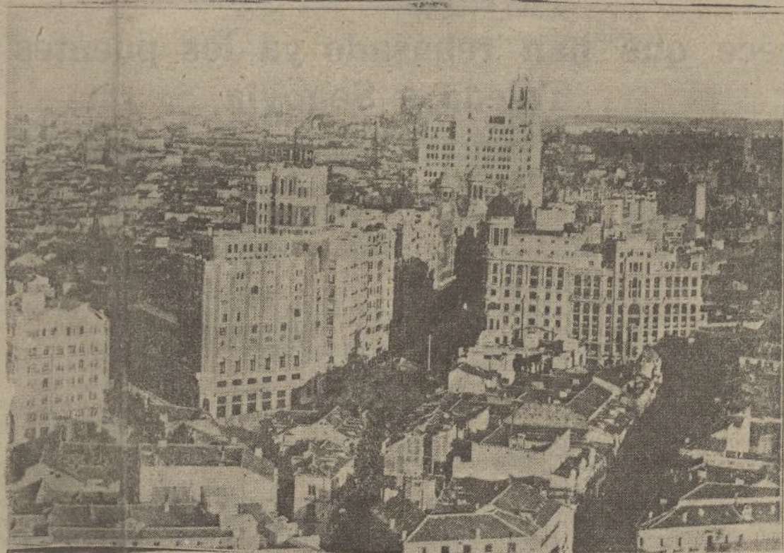
Un aspecto del Madrid moderno emergiendo, blanco y radiante, de entre los tejados y bohardillas del Madrid viejo. Ved claramente el símbolo. A lo lejos, la aglomeración urbana de esta España comprimida que es el área, no muy extensa, de la capital de la Nación.