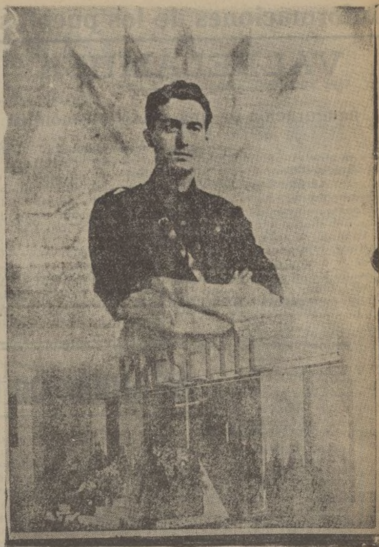
Homenaje a los falangistas muertos

Copiamos de nuestros editoriales las siguientes explícitas palabras: «España es ante todo Tradicional y predominantemente Católica». Pues bien, Falange Española acomete la magna obra de reconstrucción nacio-