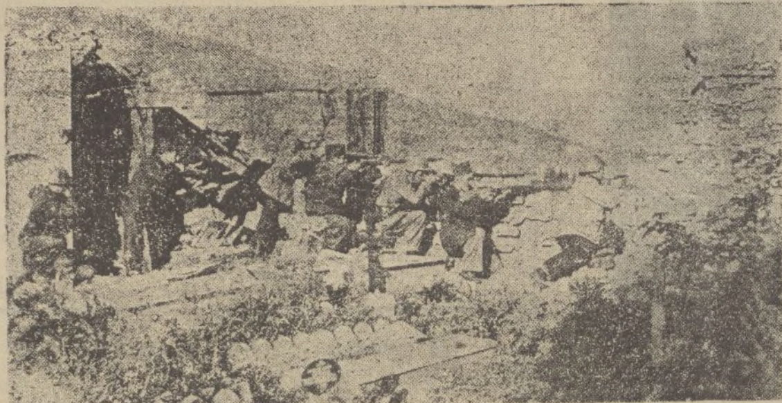
OVIEDO.—Nuestras bravas milicias rechazan un ataque de los marxistas en el Cementerio.