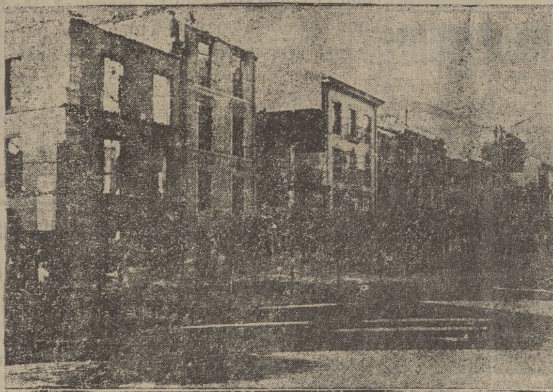
OVIEDO — Tanto en el interior de la ciudad como en los barrios extremos, los extragos de la metralla y las bombas incendiarias han dejado sin albergue a muchas familias.