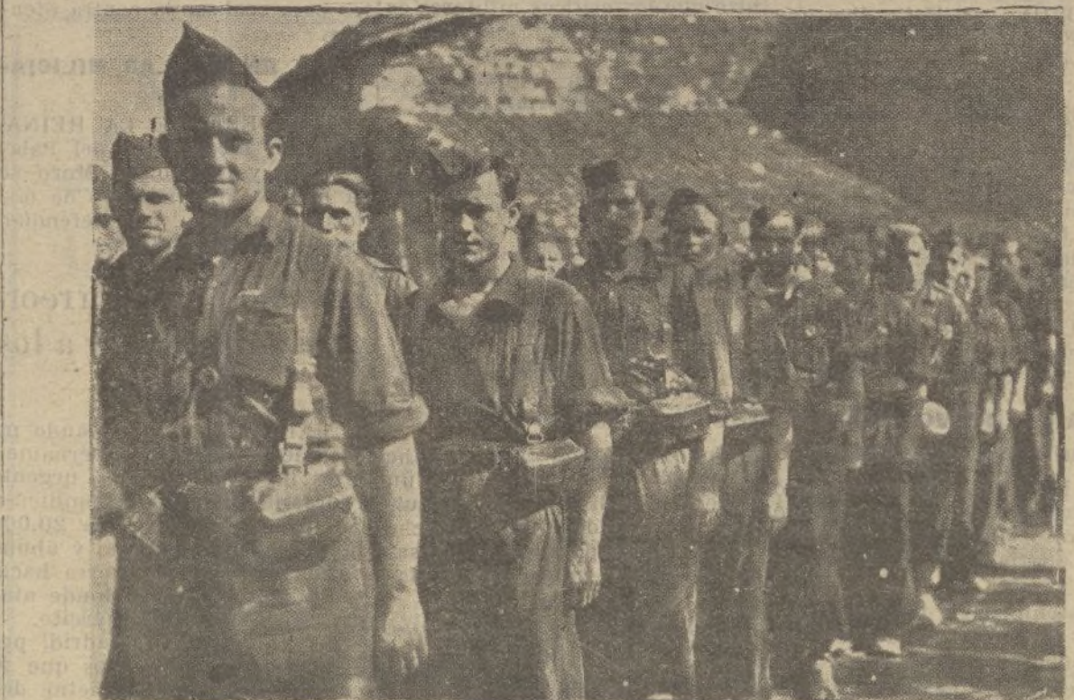
Los valientes muchachos de Falangé llenos del mayor fervor patriótico y con la sonrisa en los labios marchan hacia el frente por la conquista de una España mejor Ayuntamiento de Madrid

La ocupación de los barrios exteriores de Madrid