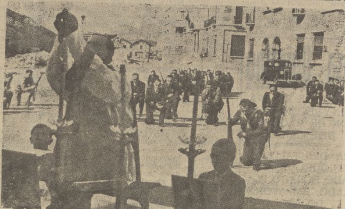
En Pasajes, la marinería de servicio en el puerto escucha fervientemente una misa de campaña