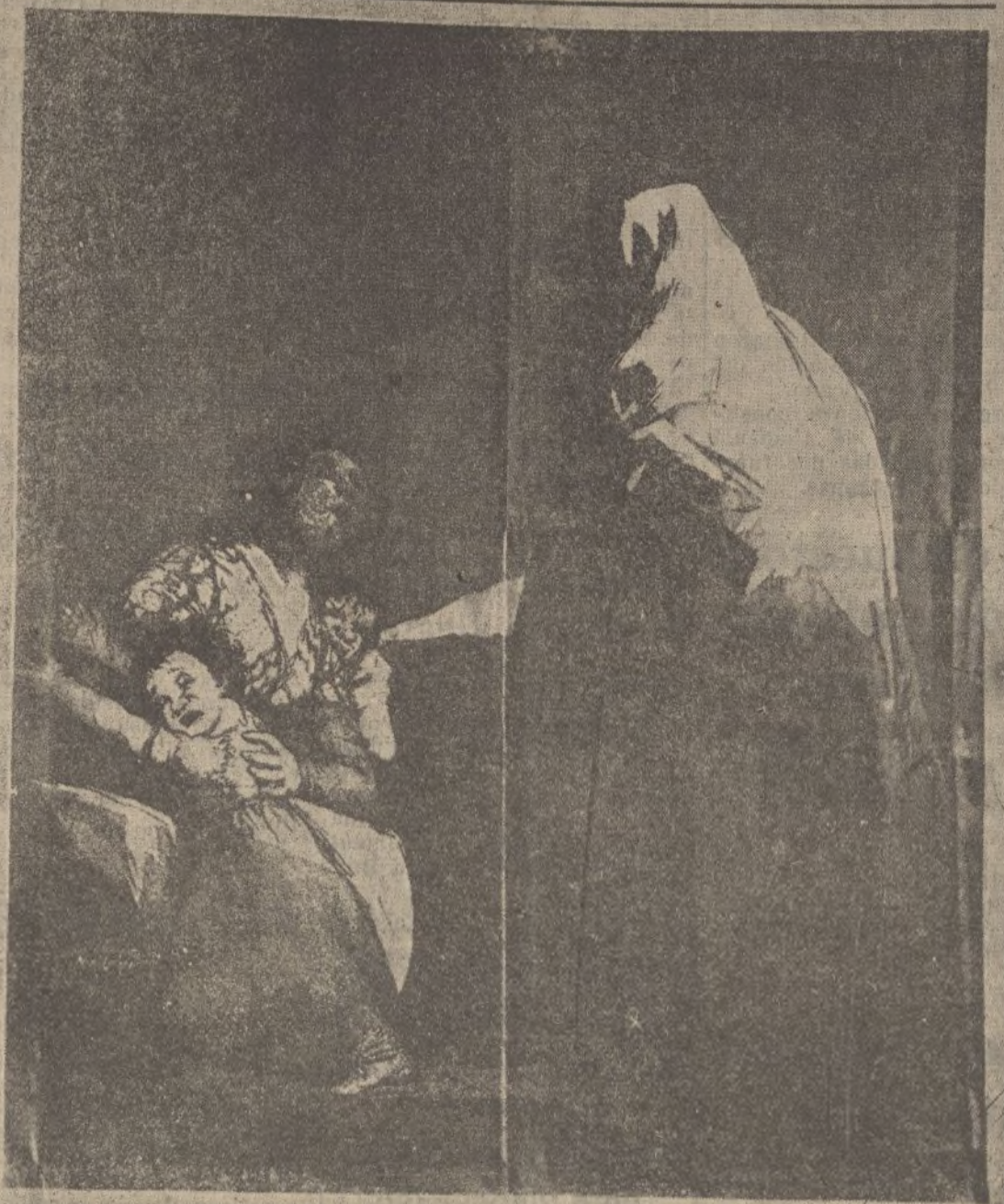
«Que viene el coco»