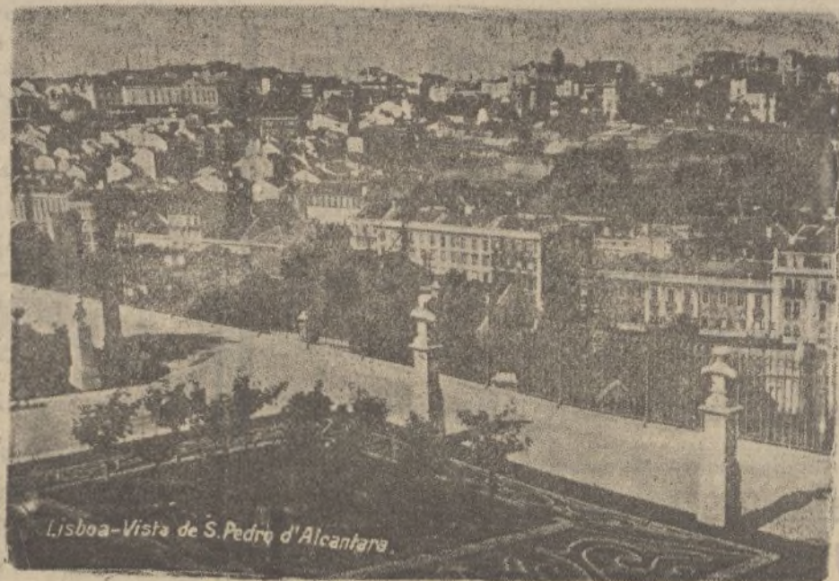
Lisboa-Vista de S. Pedro d'Alcantara