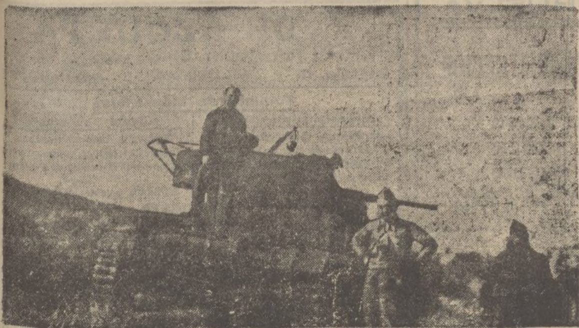
Uno de los mejores tanques rusos que las tropas nacionales cogieron al enemigo en Torrejón de Velasco.