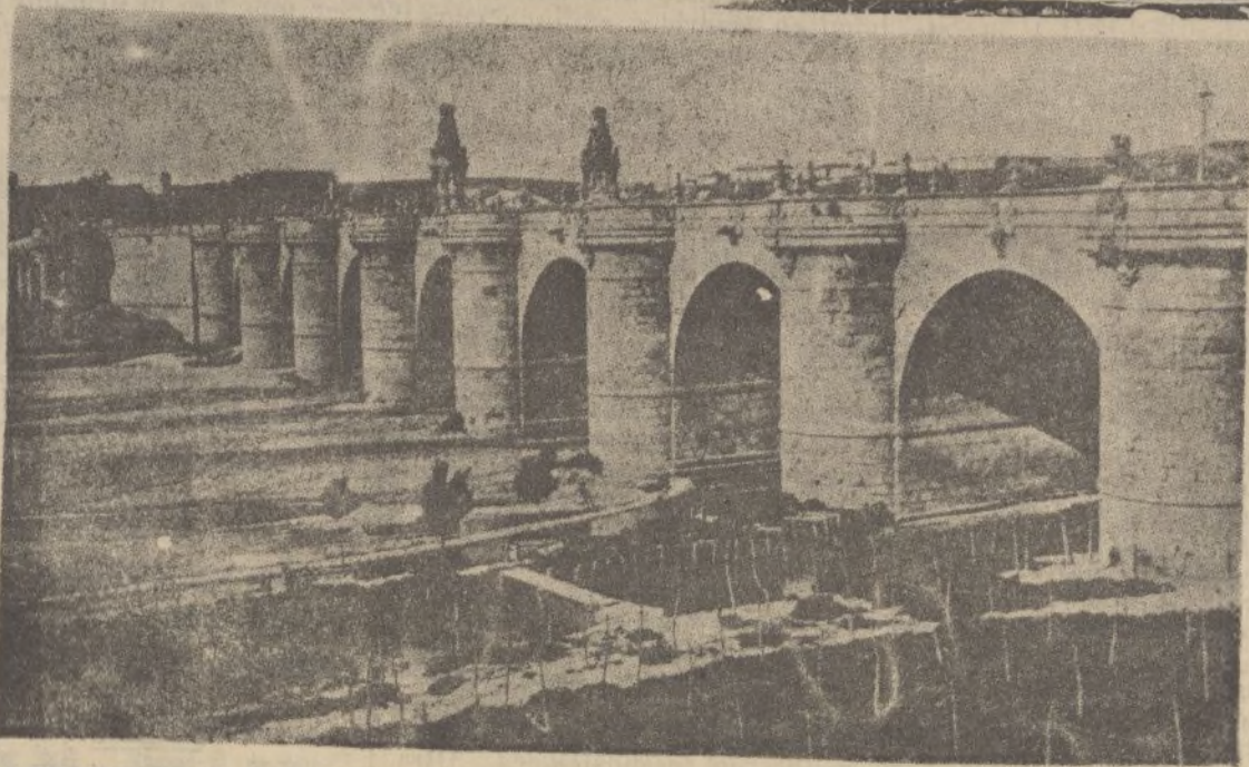
MADRID.—El puente de Toledo tomado por las tropas del general Franco después de una fuerte resistencia de los rojos, bravamente vencida por los legionarios y Regulares.