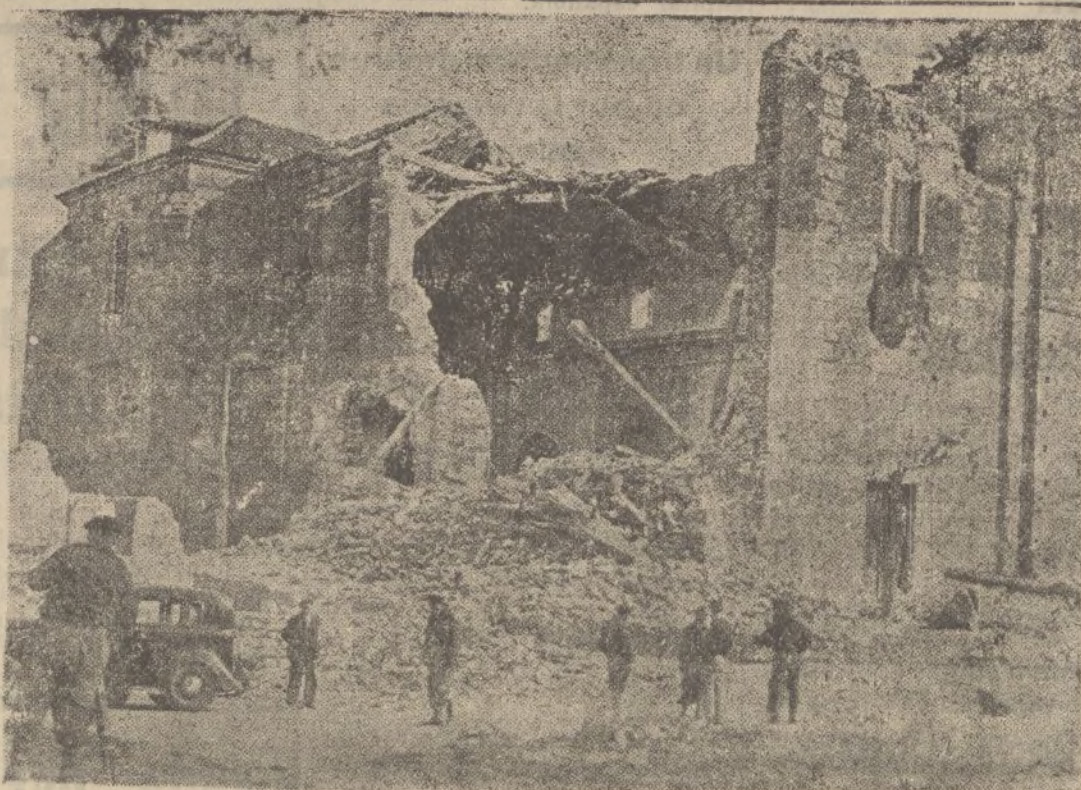
GETAFE.—Restos de la iglesia de San a María Magdalena, destruida por los rojos.