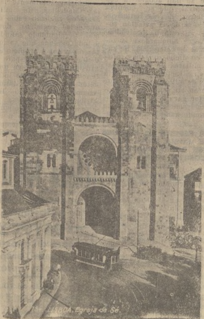
LISBOA.-Iglesia de la Sé