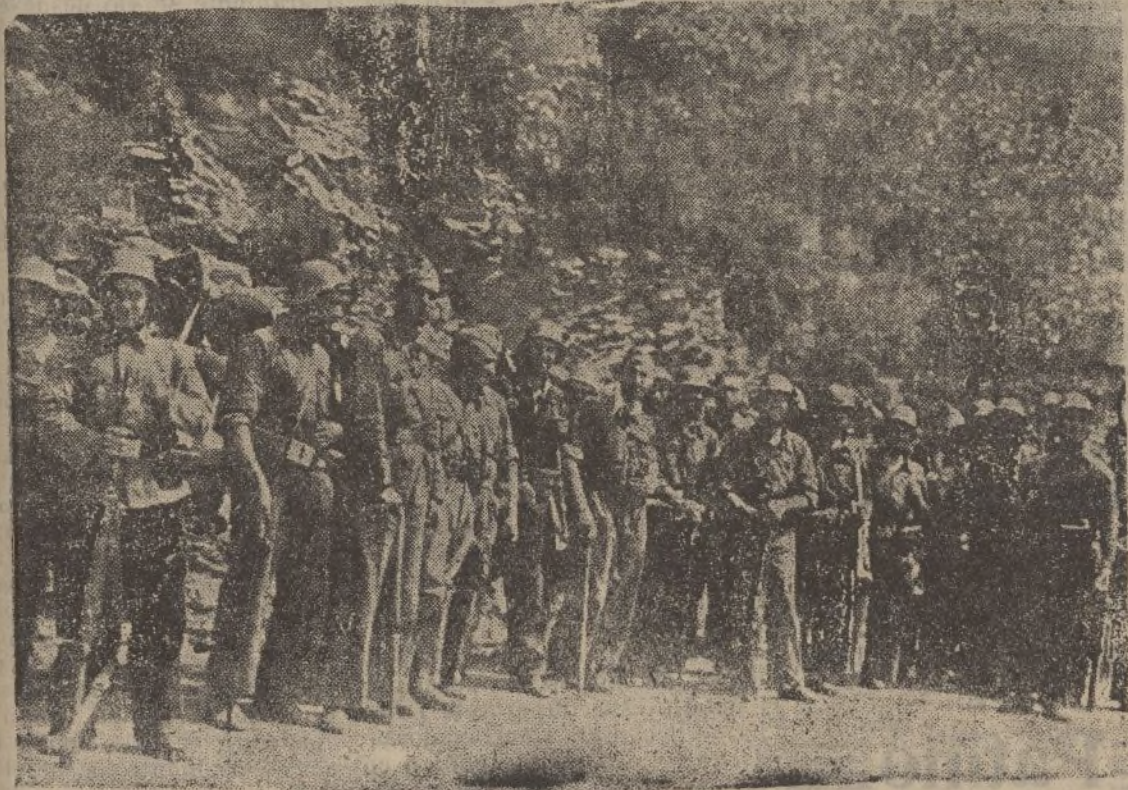
Un grupo de nuestros valientes artilleros en Asturias.