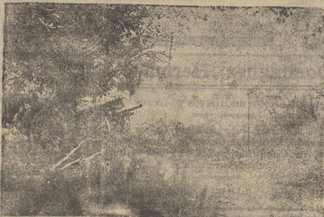
GETAFE. —Ocupada la ciudad, nuestra artillería protege el avance arrollador del Ejército.

PERPIGNAN. —El general ruso que en Barcelona ha tomado posesión del mando de las tropas catalanas, ha manifestado públicamente su opinión de que el baluarte definitivo de la resistencia debe ser Cataluña, donde se producirá la lucha que ha de ser de vida o de muerte para la victoria del comunismo en Europa.