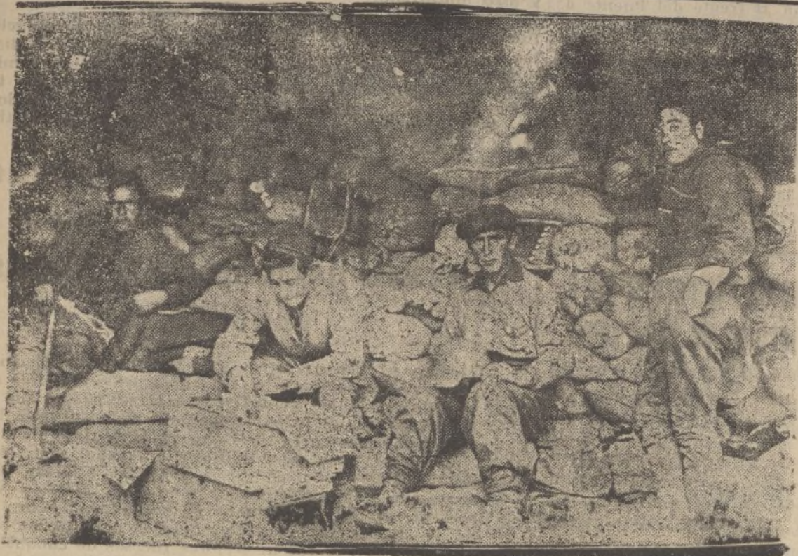
Interior de un reducto fortificado tomado al enemigo en nuestro frente de Somosierra.