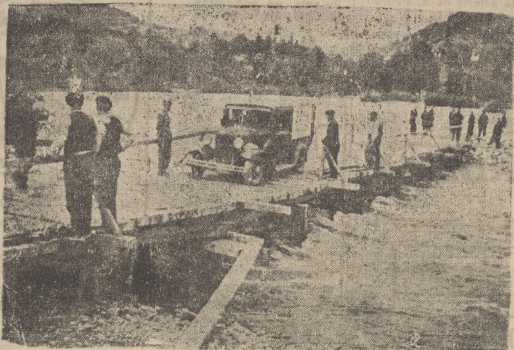
GRADO (Asturias).—Pontón construido sobre el río Narcea, en la carretera de Asturias a Galicia, en sustitución del que fué volado por los marxistas.

Las normas para la recepción referente a este servicio puede ventilarse directamente con la Delegación de la Secretaría General de S. E. al Jefe del Estado, para este servicio establecida en Valladolid, bajo la dirección postal y telegráfica D. I. D. R. E. M. (Delegación Información de Residentes en Madrid).