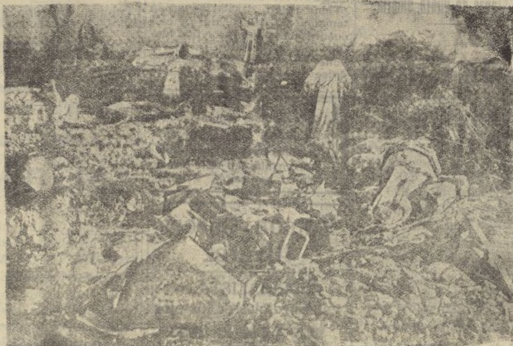
Interior de la iglesia del convento de Grignon, después de destruida por los marxistas.