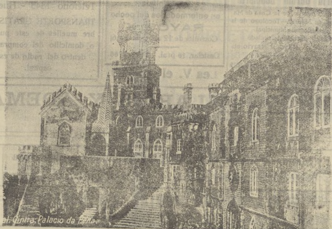
al Cintra-Palacio da Pena