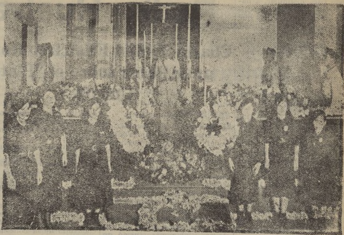
La capilla ardiente de los camaradas falangistas muertos en Los Blázquez. Les dan guardia de honor sus compañeros y una representación de la sección femenina de Pueblo Nuevo del Terrible.