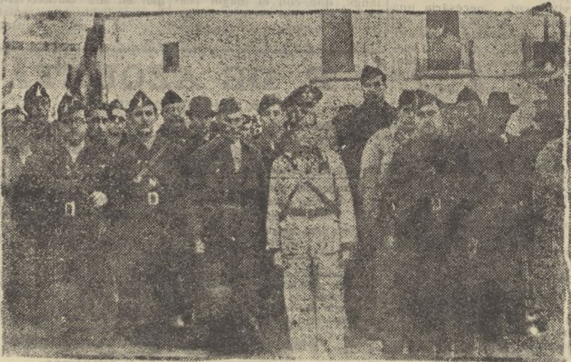
Presidencia del duelo, en el entierro verificado en Pueblonuevo, de los falangistas muertos heroicamente en Los Blázquez.

Tiempo material porque no hay, en realidad, otro óbáculo que ese. Durante toda jornada de hoy se ha acentuado aún más que en las jornadas anteriores la flojera que van sintiendo los «heróicos» defensores de Madrid; por otra parte su aviación no ha hecho acto de presencia sobre nuestras líneas avanzadas, y se