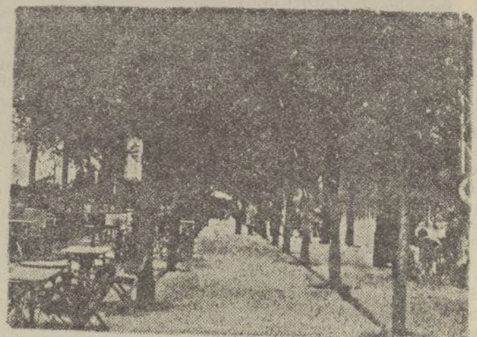
El Paseo de Rosales, en Madrid, que se halla totalmente en poder de las tropas de Burgos.