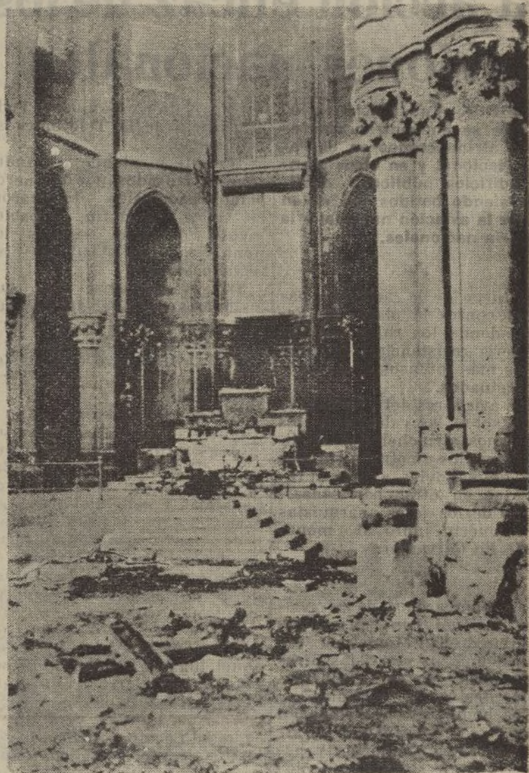
Barcelona.—Una iglesia más en la que el furor rojo sació el odio con que lo envenenaron los «intelectuales» dirigentes.

Alejandro Papanastasio fue el jefe del Partido Republicano y representó un importante papel cuando en 1924 Grecia sustituyó el régimen monárquico por el republicano. Fue entonces nombrado presidente del Consejo en sustitución de Calfandaris, que dimitió. En 1935, cuando ocurrieron los acontecimientos que precedieron a la caída de la República, Papanastasio fue detenido, siendo más tarde puesto en libertad en virtud de una amnistía.