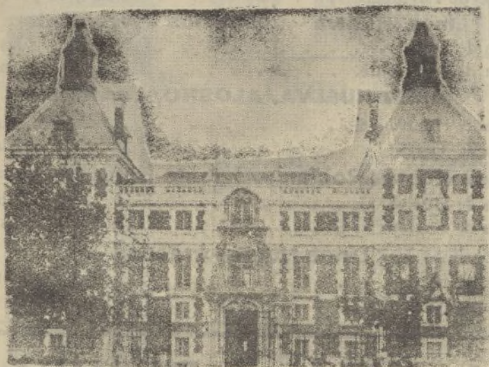
La Casa de Velazquez, en Madrid, que ha caído en poder de los nacionales