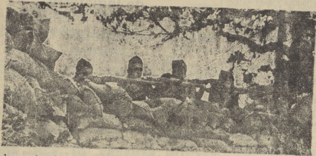
Soldados nacionales, en el frente de El Escorial, disparando sobre las posiciones de los rojos.