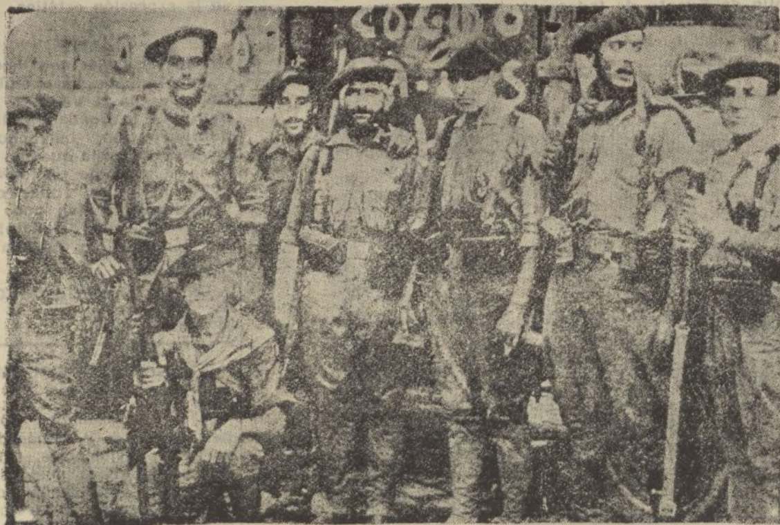
Grupo de requetés descansando después de un combate en el que cogeiron a los rojos enorme cantidad de material de guerra

X LEA VD. X TODAS LAS MAÑANAS X X DIARIO DE HUELVA X