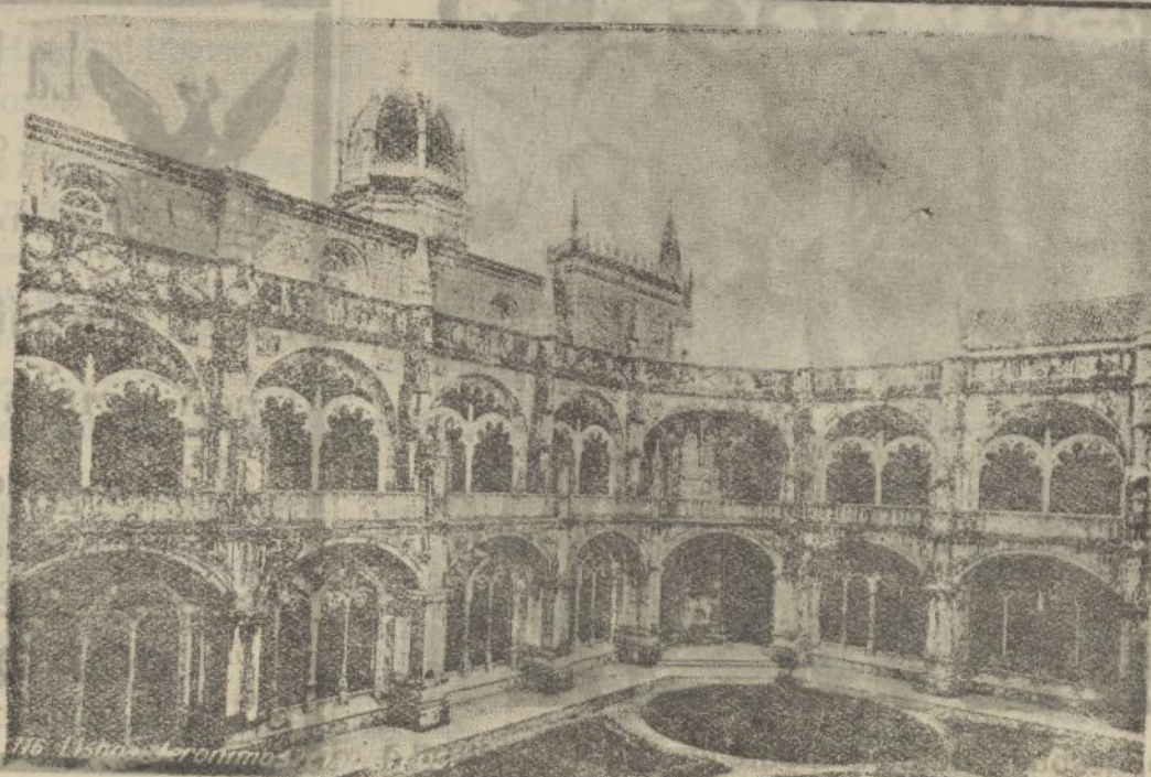
LISBOA.-Jerónimos. Claustros. Ayuntamiento de Madrid

Precio: 3'00 pesetas. De venta únicamente: Papelería DIARIO DE HUELVA Calvo Sotelo, 15