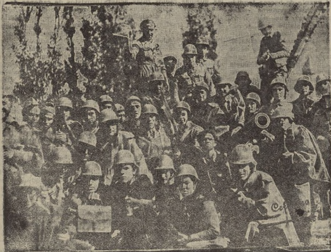
Los bravos muchachos que luchan en los picachos serranos desde los primeros días del alzamiento nacional, posan un momento ante el objetivo del reportero.