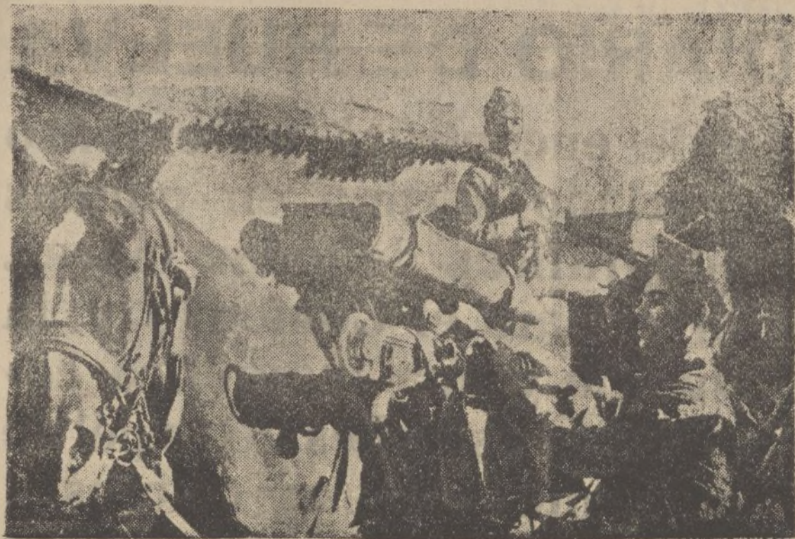
En una zona de Madrid, un soldado nacional coloca una ametralladora sobre el lomo de su caballo.