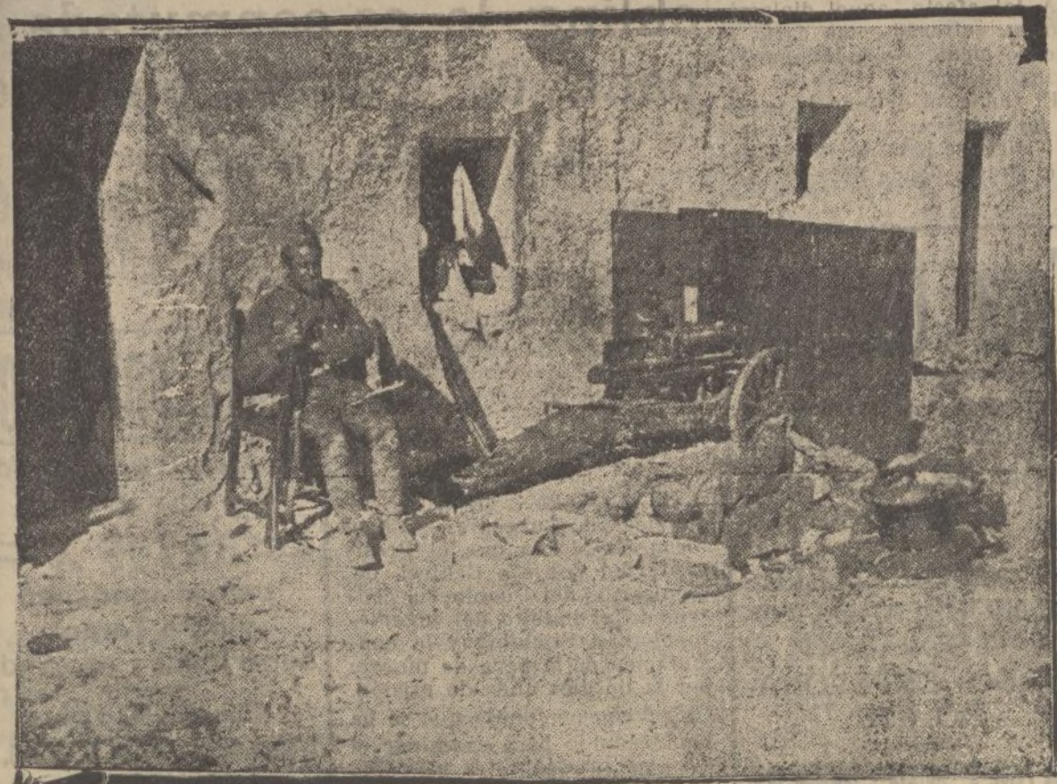
A la retaguardia de nuestro Ejército de operaciones, numerosas tropas guardan el paso de convoyes y carreteras.

Predice, finalmente, que Francia, después de ser víctima de todas las corrupciones de los marxistas, adoptará el fascismo.