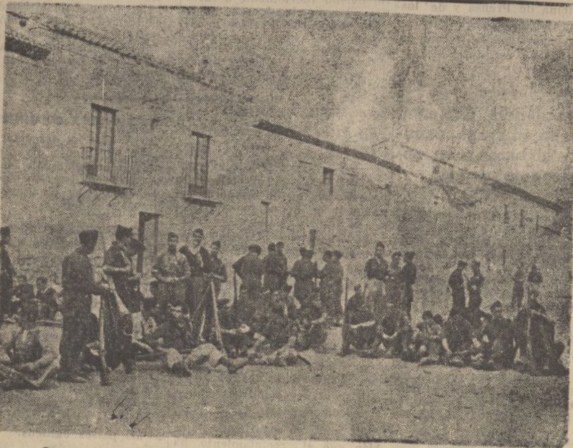
Ocupación de un poblado por las fuerzas salvadoras de España.