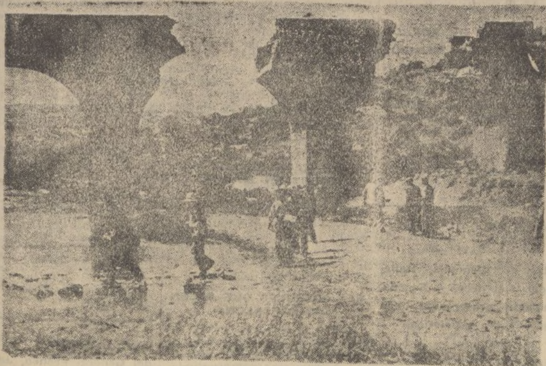
Puente destruido por los marxistas en la provincia de Sevilla.