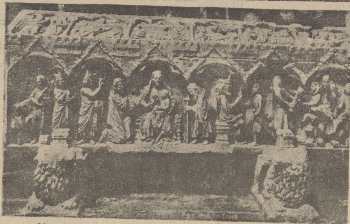
Monasterio de las Huelgas, panteón de los reyes de Castilla. Ayuntamiento de Madrid

Acordáos del nefasto pacto de San Sebastián, vergonzoso contubernio de españolistas como Alcalá Zamora y Miguel Maura son separatistas desca-