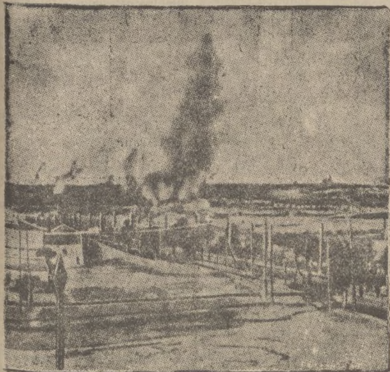
Explosión de una granada en Madrid. Vista tomada desde las líneas nacionales.