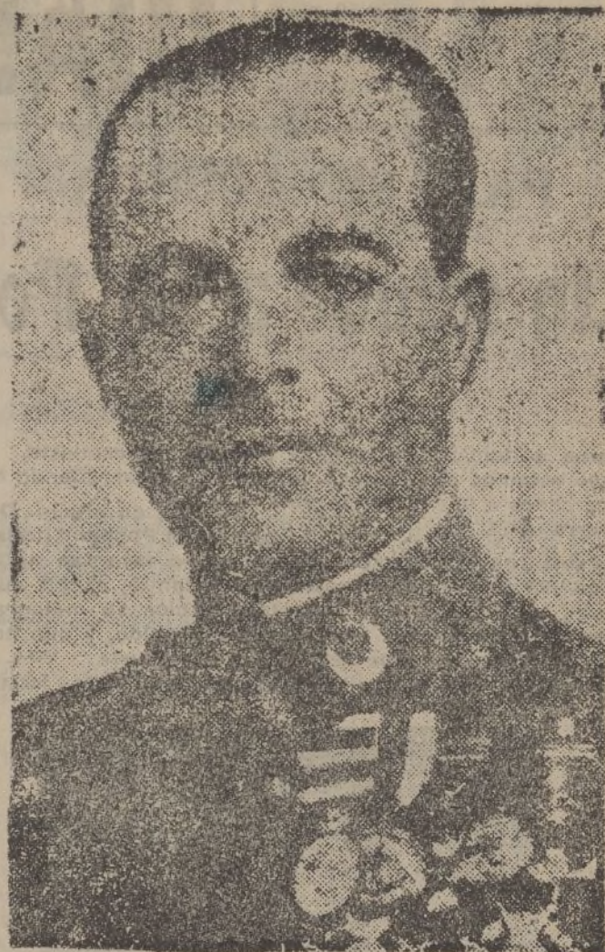
El bravo general Varela, que con tanta pericia lleva la ofensiva general contra Madrid.

En la imprenta de este DIARIO se confecciona toda clase de trabajos comerciales Ayuntamiento de Madrid