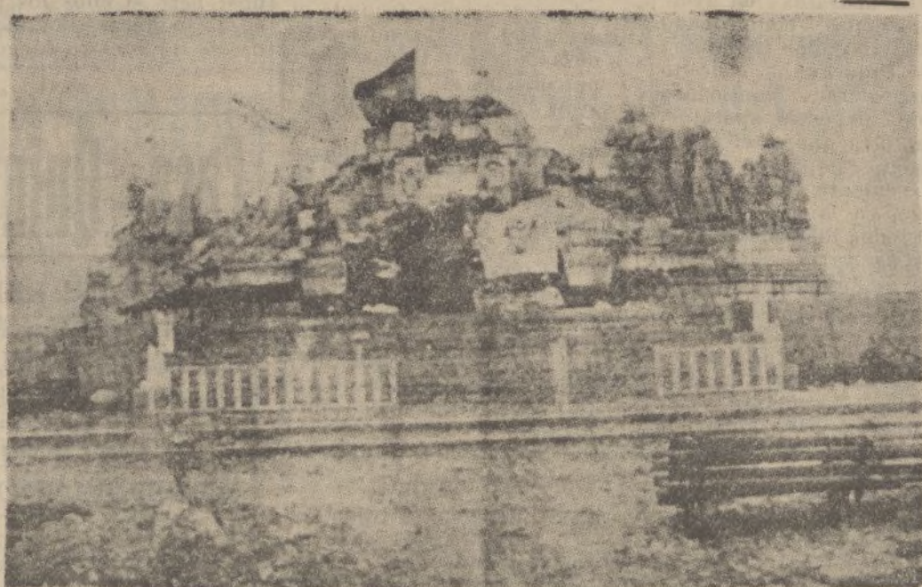
Estado en que quedó el monumento del Cerro de los Angeles después del atentado de que fué objeto.

Castelar, 40. principal, en HUELVA, para más informes.