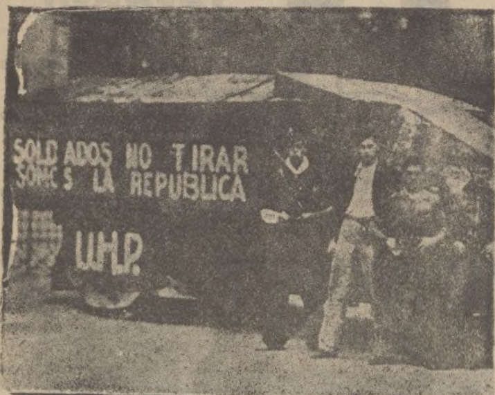
Uno de los camiones blindados cogido por nuestros soldados a los rojos en la toma de San Sebastián. Por la inscripción se adivina el miedo anticipado que después les hace huir a todo gas

Lea todas las mañanas «Diario de Huelva»