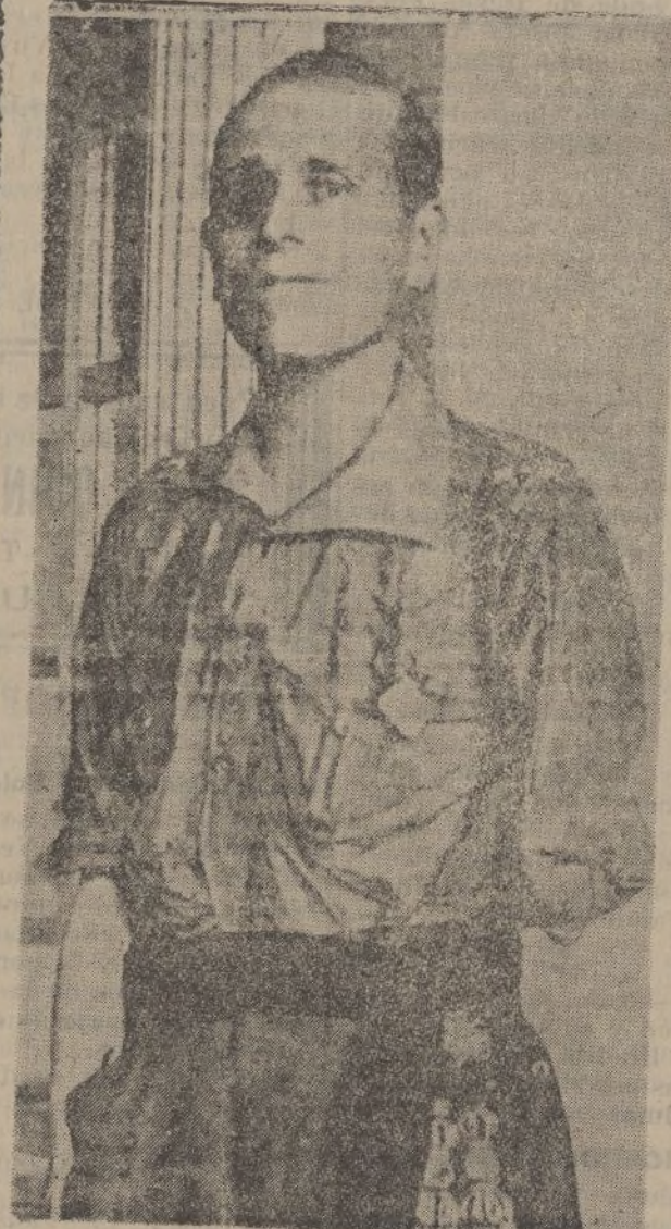
El glorioso general Mulán Astray, nombrado jefe de Prensa y Propaganda por el Generalísimo Franco

VALLADOLID.—En el frente de Aragón, los marxistas catalanes atacaron el sector de Almudévar-Santa Quiteria, pero fueron rechazados con más de trescientas bajas.