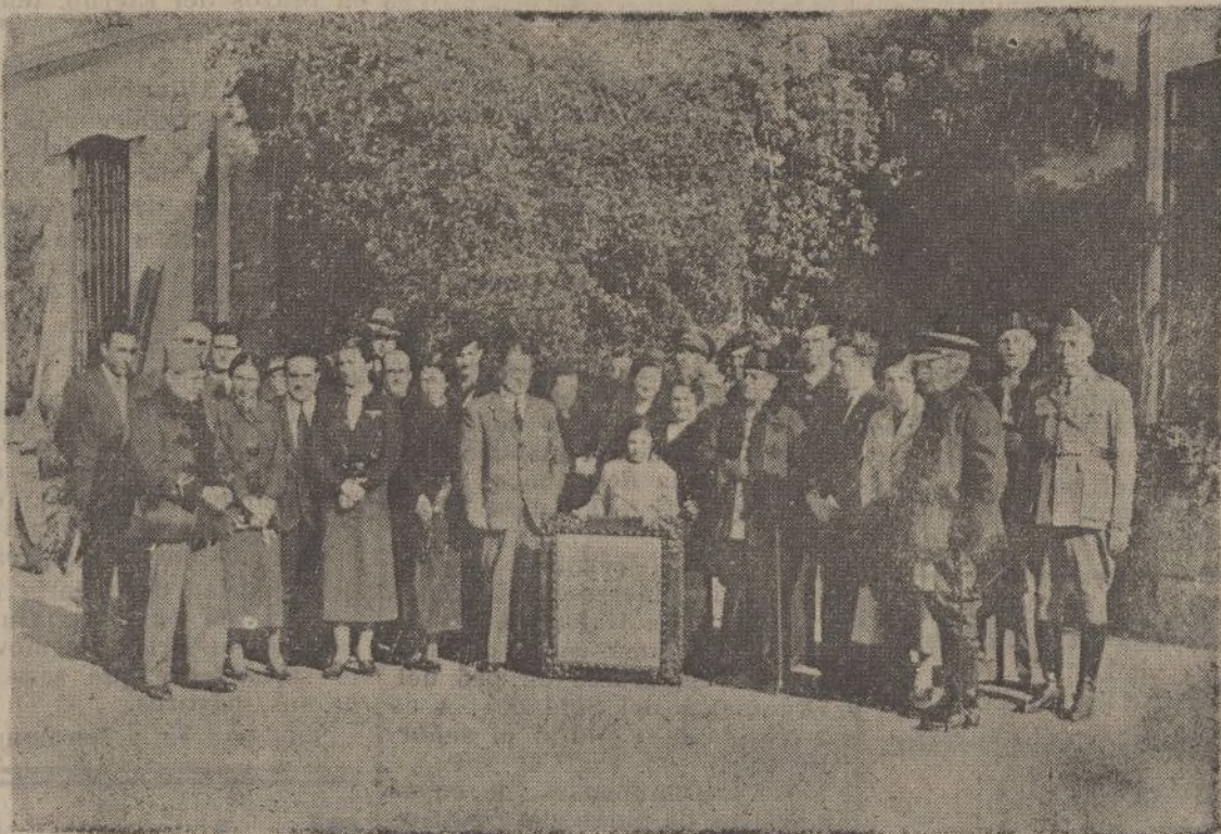
El gobernador civil, con su distinguida esposa y autoridades y demás invitados en el acto de la inauguración del Hospital de Sangre de la Cruz Roja

tamaño 47 por 23 con la de Falange Española y España, con inscripciones patrióticas, 0'40 una Papelería DIARIO DE HUELVA Calvo Sotelo, 12-Teléfono 1477