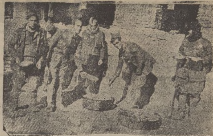
La hora del rancho a retaguardia del Ejército de operaciones.