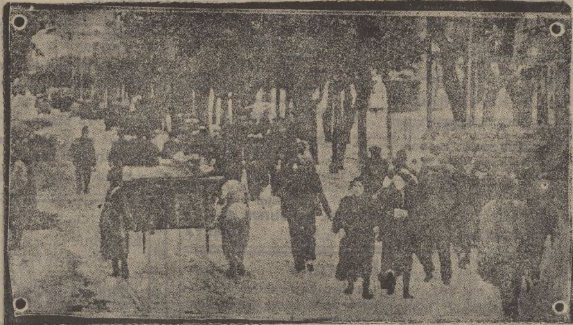
Un aspecto de las calles de Madrid. Sus habitantes tratan de eludir el peligro, mudándose a los barrios más apartados de la guerra. Algunos tratan de salvar sus muebles, cargando con ellos para realizar una imprevista mudanza.