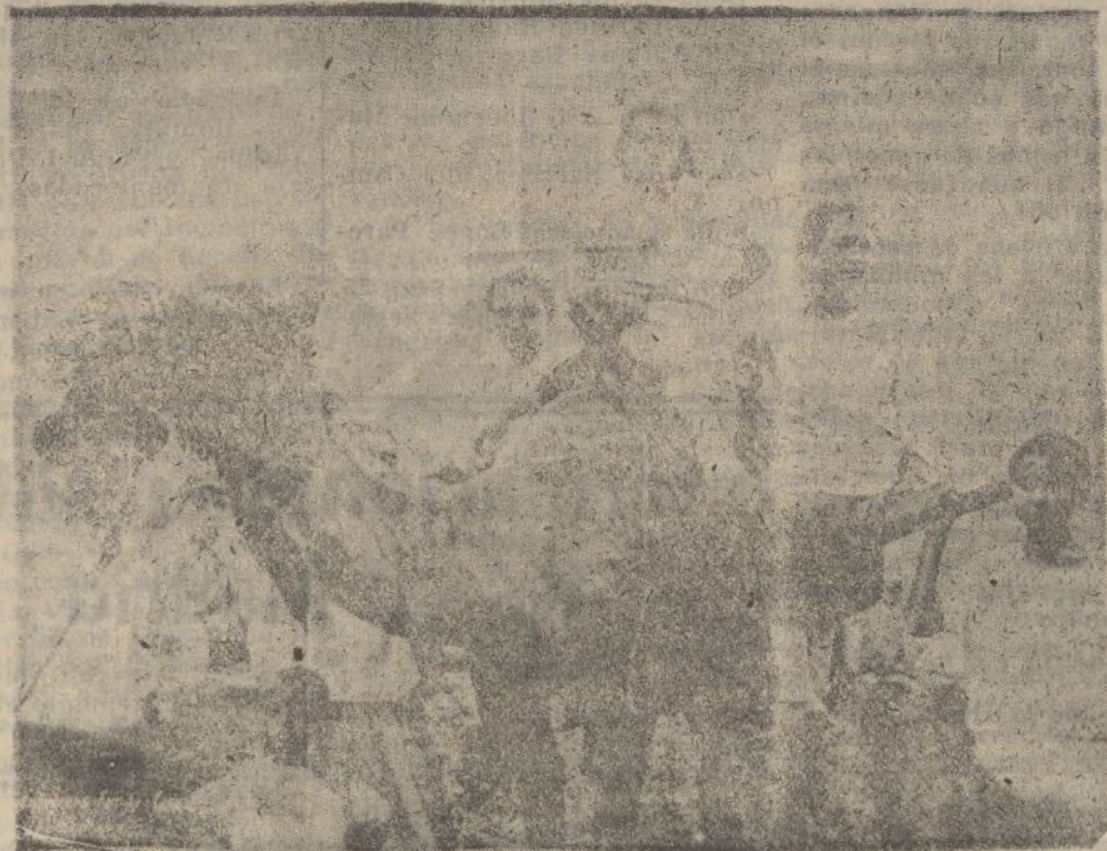
CANARIAS.—Uno de los camellos característicos de aquellas hermosas islas, sobre cuyas jorbas se alzan, solemnes y guapas, dos magníficos ejemplares femeninos.

TRANSPORTE GRATIS sobre muelles de este puerto o domicilio del comprador, dentro del radio de esta capital.