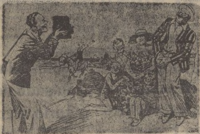
EL FOTÓGRAFO DE PLAYA (al padre de familia). Usted muy natural; en la postura en que acostumbra estar.