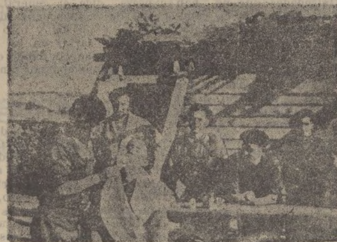
Barbería de campo en Navatría.

X LEA VO. X TODAS LAS MAÑANAS X DIARIO DE HUELVA