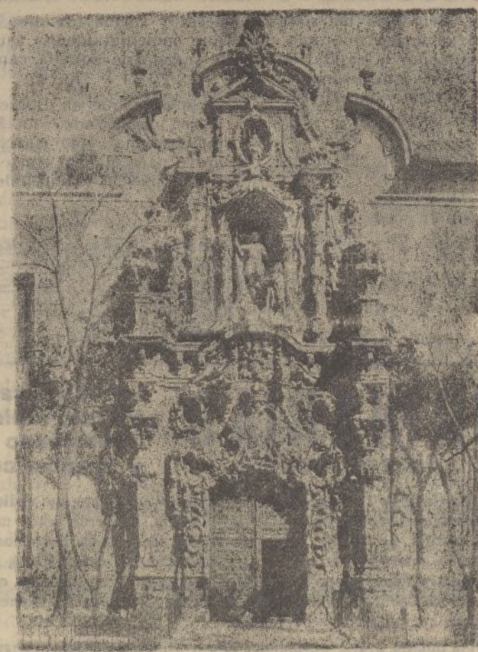
MADRID.—Magnífica portada, (obra maestra de Churriguera) del antiguo Horpicio; después convertido en Museo Municipal, y ahora... lo que los rojos hayan querido hacer de él.