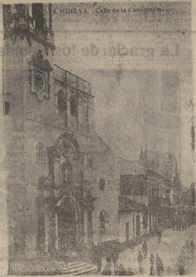
Bella fachada de la Parroquia de la Concepción, antes de ser destruida e incendiada. Huelva la reedificará. El nuevo reloj dicen dará la hora de las 12 en la noche de Navidad