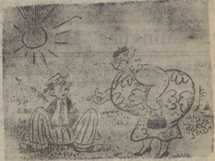
LA MUJER.—Déjame tu pañuelo para sentarme encima. (De «Ric et Rac», de París.)

Hay también otros expresivos testimonios de la situación desesperada de las fuerzas defensoras de Madrid; por ejemplo: la petición urgente y reiterada de material de guerra, el llamamiento angustioso que por las Radios rojas se hace al proletariado inglés para que ayude materialmente a la causa marxista española y la llamada apremiantísima que hacía la emisora de la C. N. T. de Chamartín de la Rosa, para que todos sus afiliados, sin excusas ni pretextos, se presentasen a las cinco de esta tarde en el domicilio social, donde recibirían instrucciones. Además, todos los permisos de descanso o de convaleciente, dados a las fuerzas defensoras de Madrid, han sido anulados. Por otra parte, los periódicos madrileños han desencadenado una furiosa ofensiva en sus columnas contra Alemania e Italia, diciendo que estas dos potencias han quebrantado los pactos internacionales al reconocer oficialmente al Gobierno del general Franco, y «El Socialista», por su cuenta, escribe estas muy expresivas palabras: «No hay duda de que el triunfo de nuestra causa está próximo, pero todas las potencias democráticas deben pensar de que si triunfase el fascismo en España ellas desaparecerían del mapa mundial».