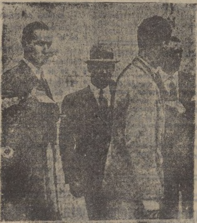
Los príncipes Alfonso y Alvaro de Orleans y Borbón a su llegada a Lisboa camino de España.