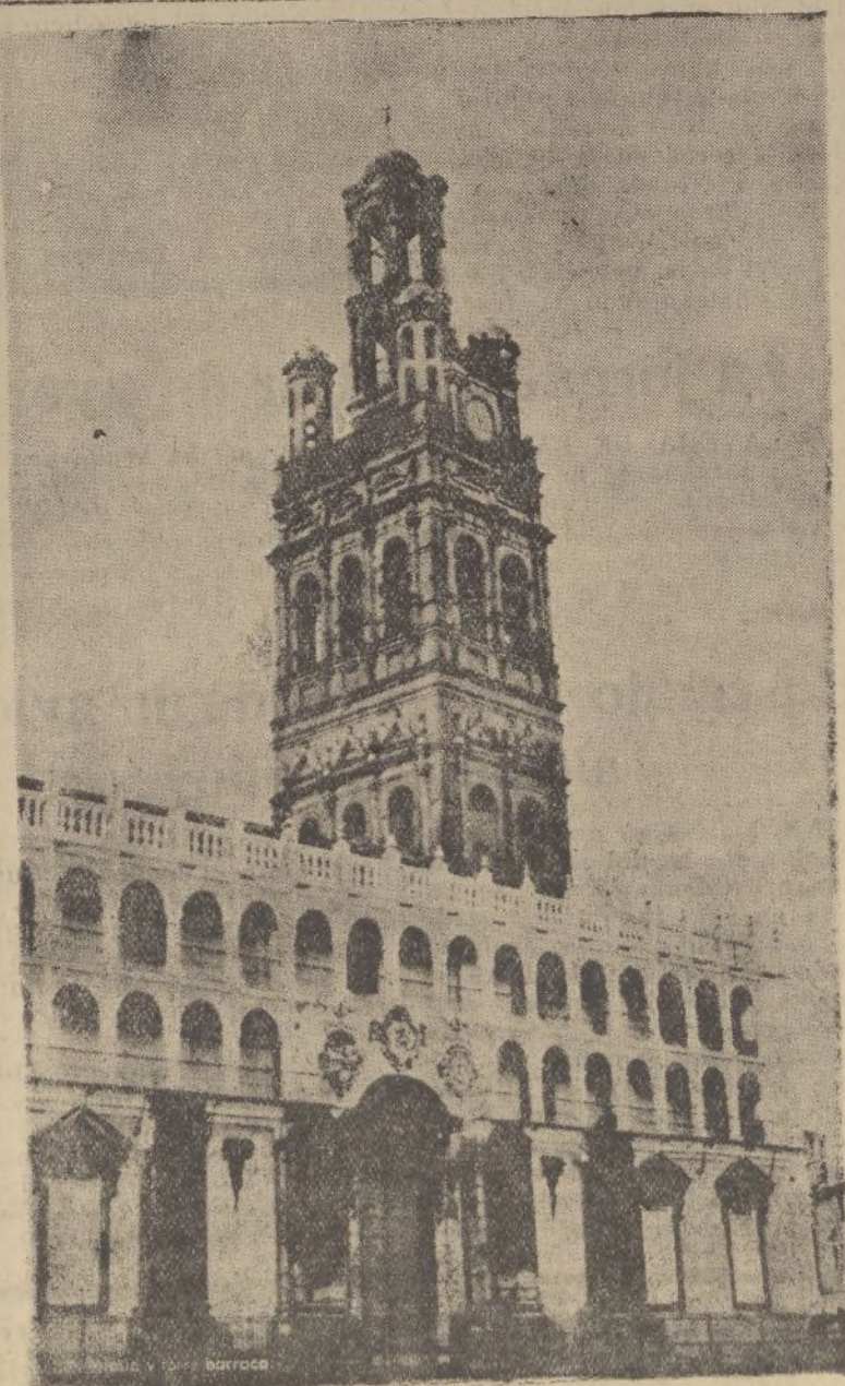
LLERENA, (Badajoz).-Iglesia y torre barroca

Per la gioia del lavoro per la pace e per l'Alloro,