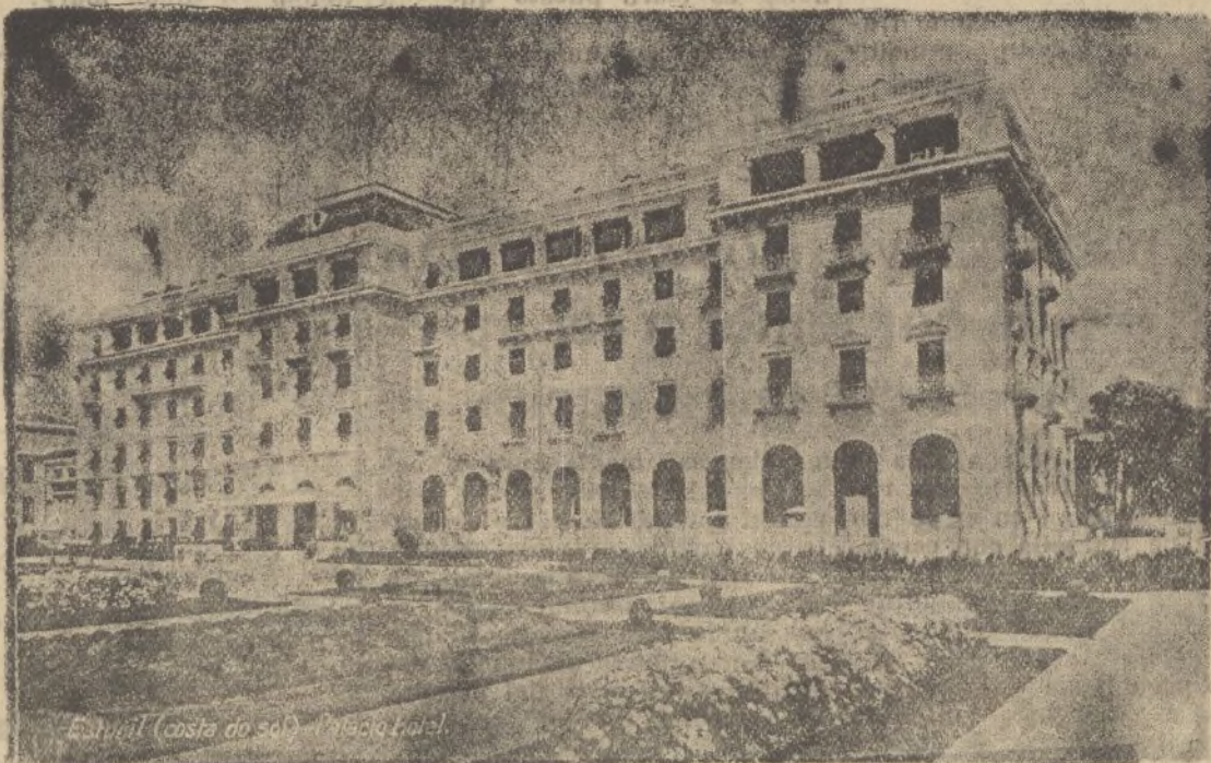
Estoril (Costa de sol).-Palacie Hotel.