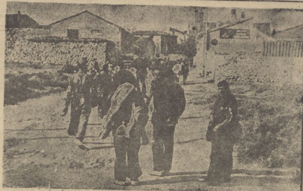
Los milicianos rojos, ante el empuje de nuestras fuerzas se entregan docilmente