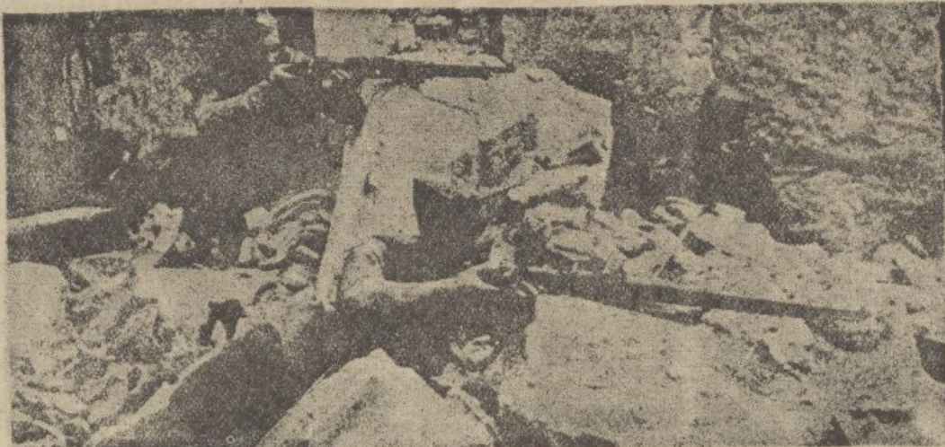
Los escombros de una casa destruida por los rojos, sirven de parapeto a nuestros soldados, que persiguen con sus disparos a los marxistas en fuga