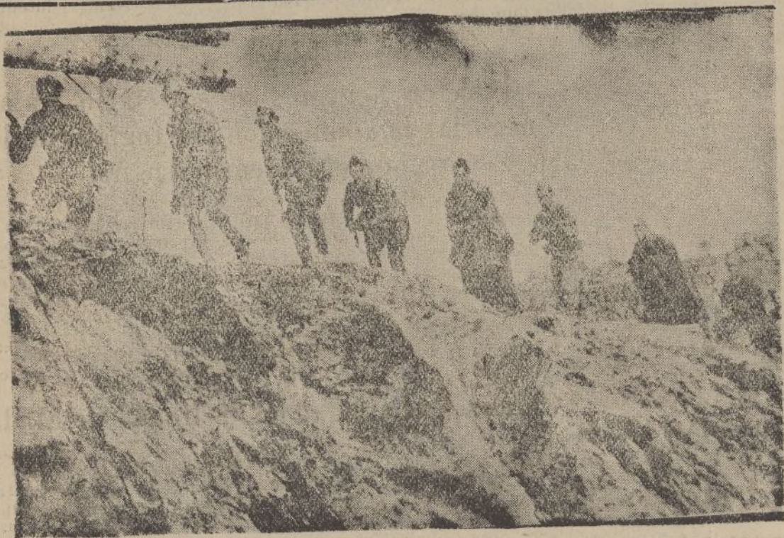
Nuestros soldados conquistan posiciones en todos los frentes.