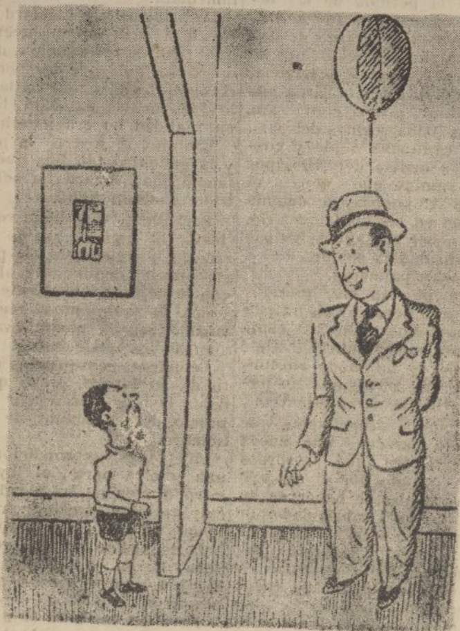
EL PADRE.—¿A que no adivinas lo que te traigo?

Horas de matrículas, de 6 a 8 de la noche.