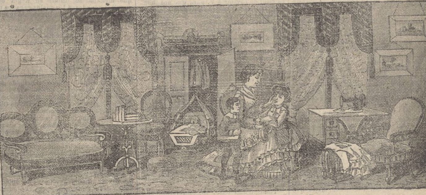
HOGARES FELICES—EFECTO DE LA RESPUESTA.

ESCENA ANTES DE LA INVENCIÓN DE LA MÁQUINA DE COSER.