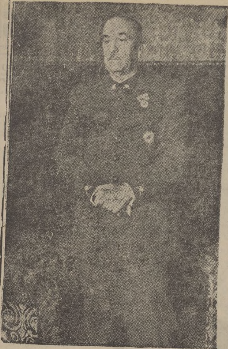
Excmo. Sr. D. José Moscardó, glorioso defensor del Alcazar y actualmente General de la División de Soria