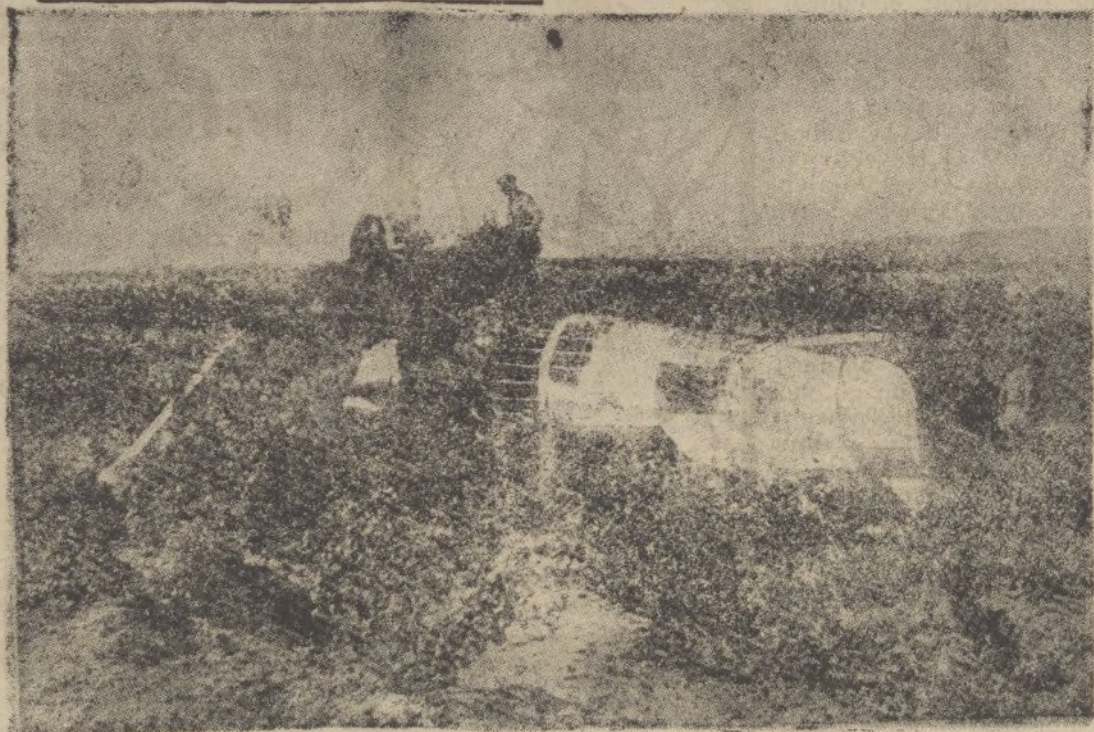
Un aparato de caza de procedencia rusa abatido en las cercanías de Carabanchel Ayuntamiento de Madrid

Acuerdo de la Junta de patrones del Bañero del Odol sobre casión al Ayuntamiento del edificio del Bañero.