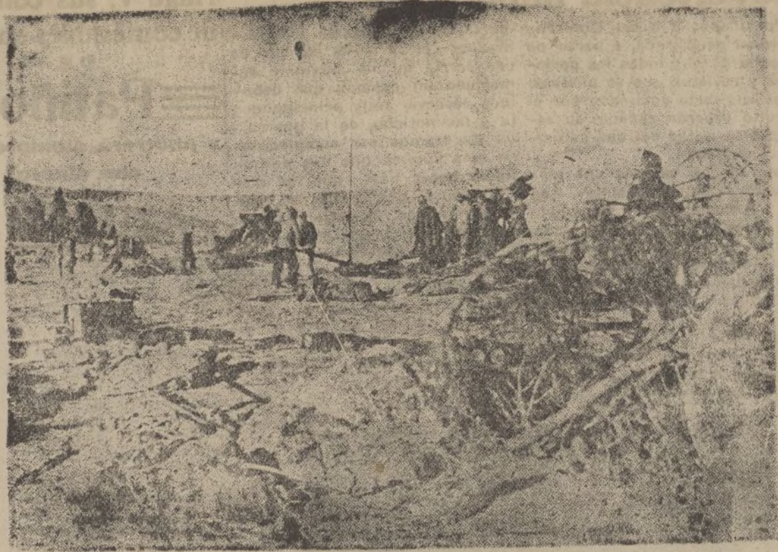
Cañones de grueso calibre ayudan a despejar de enemigos las avanzadas que se oponen a nuestros avances

En la imprenta de este DIARIO se confecciona toda clase de trabajos comerciales