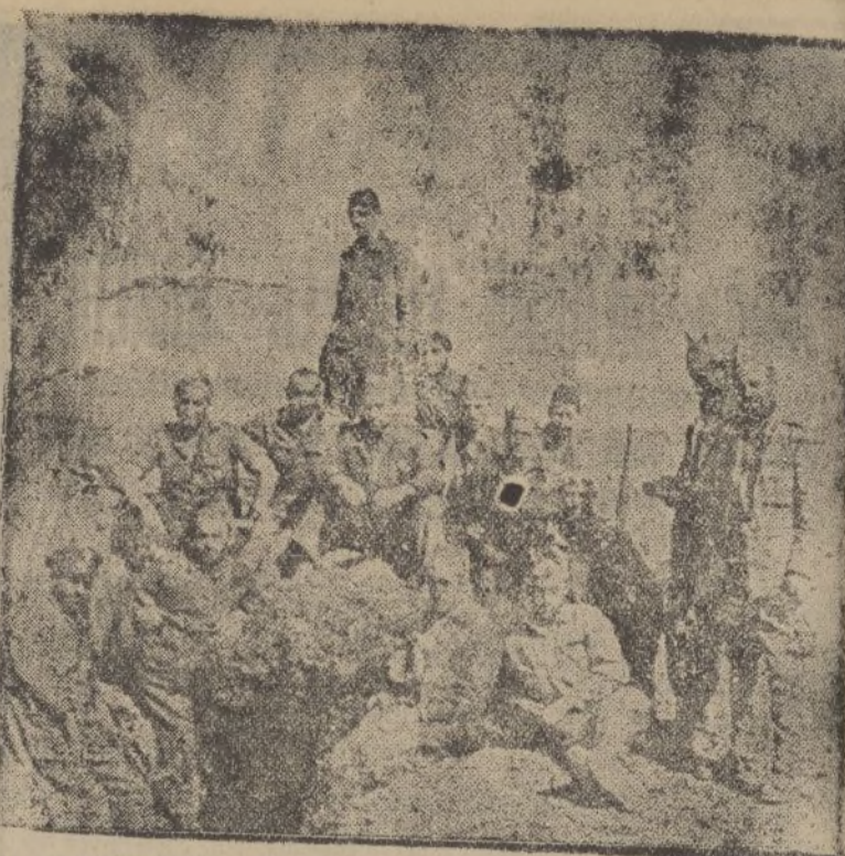
Abrigo subterráneo oculto a la vista de los aviones rojos, en una de nuestras posiciones en terreno árido, sin peñas ni arbolado que la resguarde ni disimule.