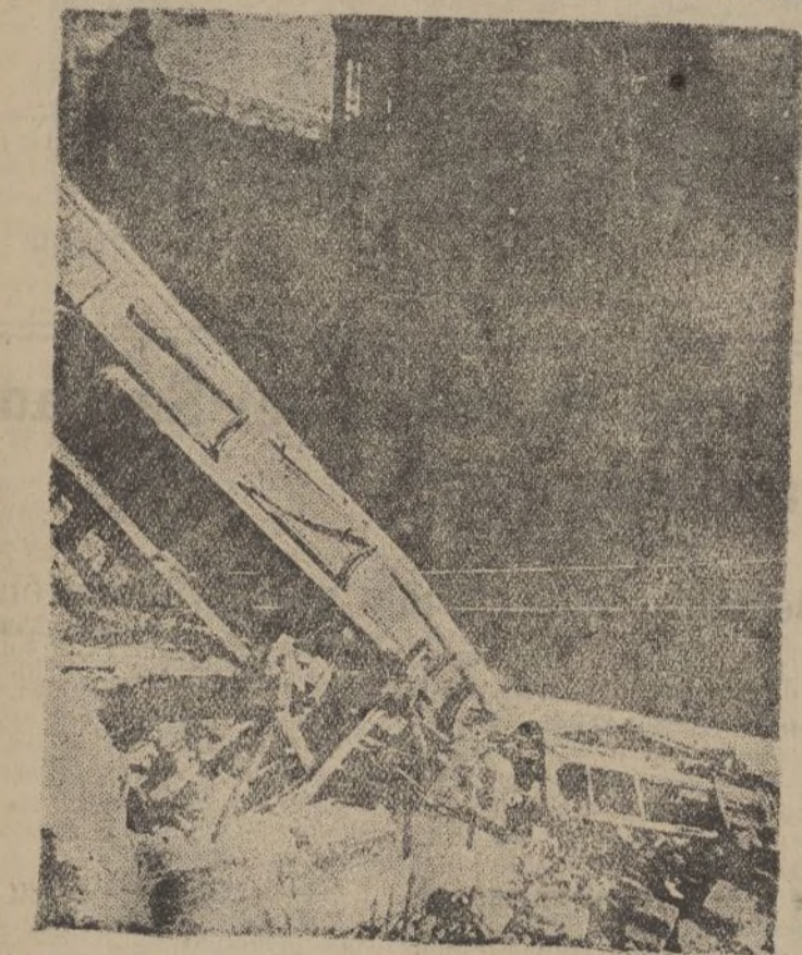
Hé aquí el estado en que quedó, después de los constantes bombardeos del asedio de Oviedo, una de las casas de la calle de Uria.