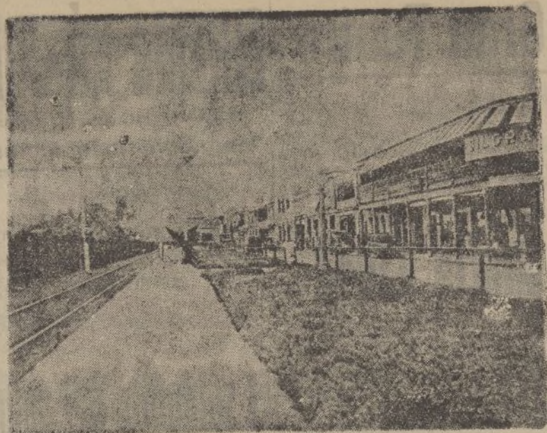
PANAMÁ.-Ciudad-Colón. Calle del Frente.