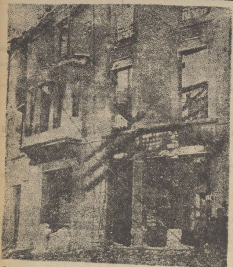
Las casas de los arrabales de Oviedo que, durante el asedio, cayeron en poder de los marxistas, quedaron como ésta: reducidas a un montón de escombros calcinados.