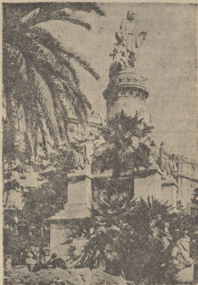
GENOVA.-Monumento a Cristóbal Colón