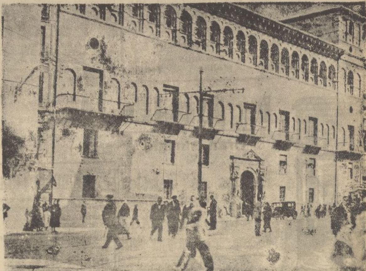
ZARAGOZA.—Palacio de Justicia.

Plaza de las Monjas, 3 - Apartado 125 - Teléfono 1520