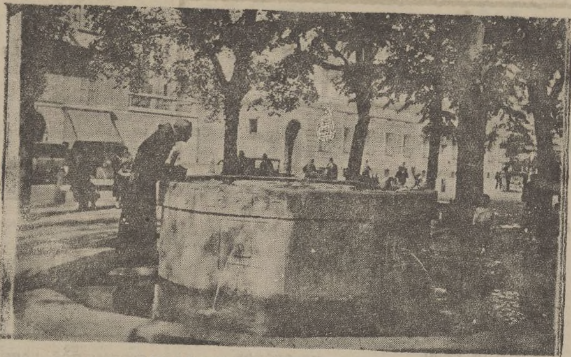
MILANO.-Fontana de San Francisco