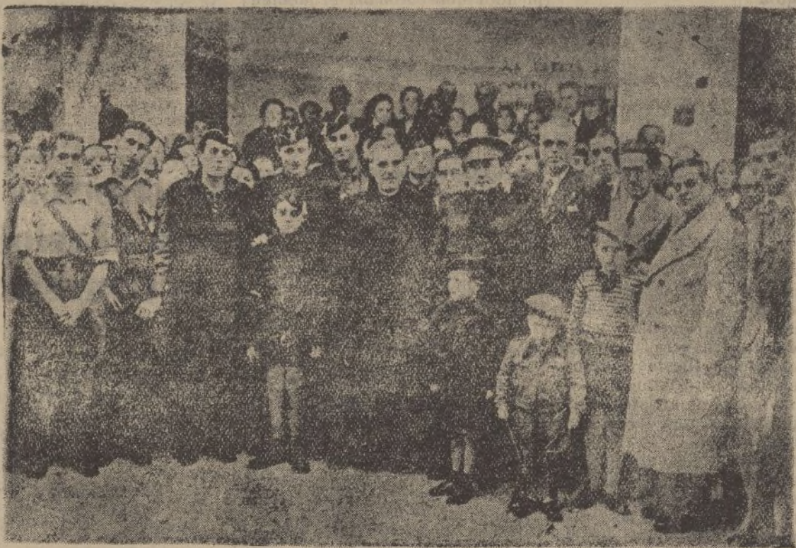
Las autoridades civiles y militares presentes en el acto celebrado el lunes pasado en las Escuelas del Sagrado Corazón de Jesús

No sé cómo darles las gracias y comunicarles mi agradecimiento por las noticias recibidas; fué tan grande nuestra alegría, que no hay palabra capaz de poder expresarla. La noticia cundió por el pueblo como reguero de pólvora, y puedo decir que todos participaron de nuestra dicha. Nuestra alegría fué colmada al recibir, hace unos