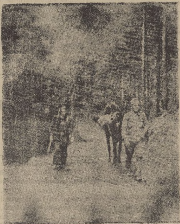
Un correo a través de las montañas del sector de Somosierra.