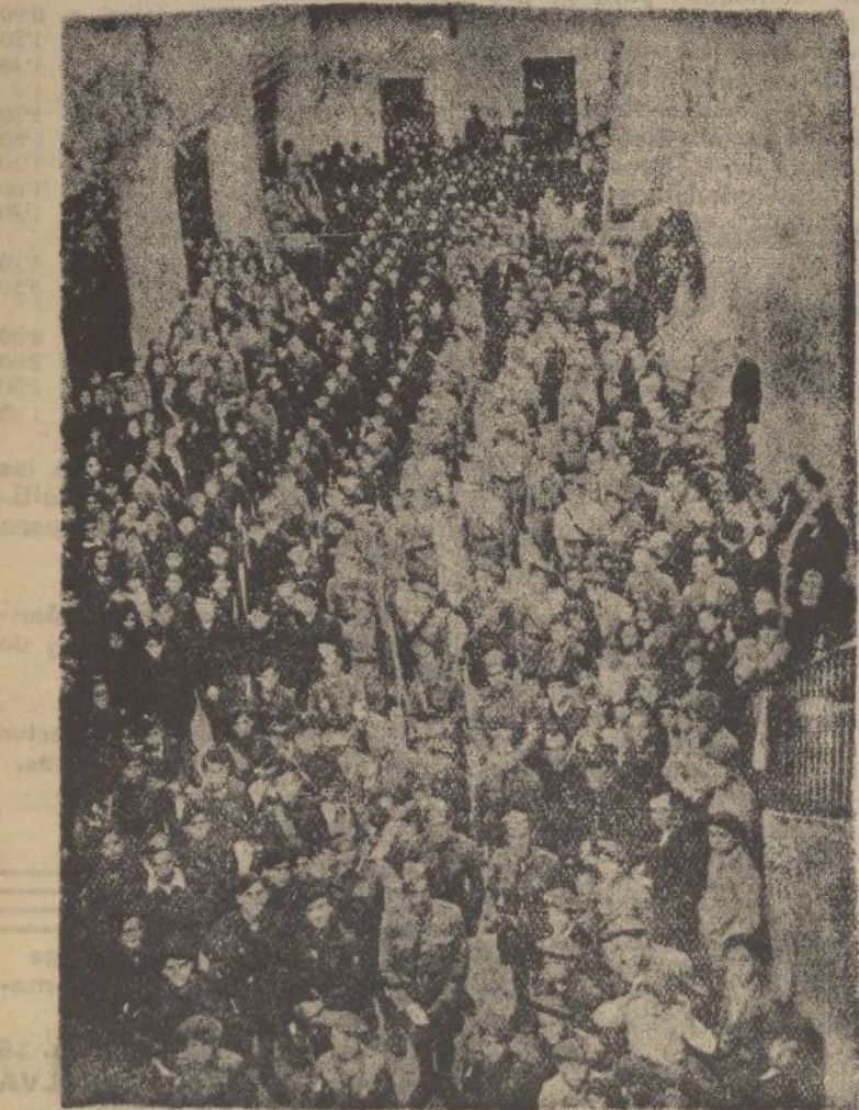
Fuerzas de «flechas» y «pelayos» que asistieron al acto de la reconstrucción de las Escuelas del Sagrado Corazón de Jesús

En esta noche, en que el hogar adquiere resplandores eucarísticos, acordémosnos de nuestros soldados que luchan en el frente por una Patria grande y cristiana y de aquellos otros hermanos nuestros que el odio rojo les ha privado del hogar y hasta de familia. Para todos ellos, nuestro recuerdo y nuestro cariño.