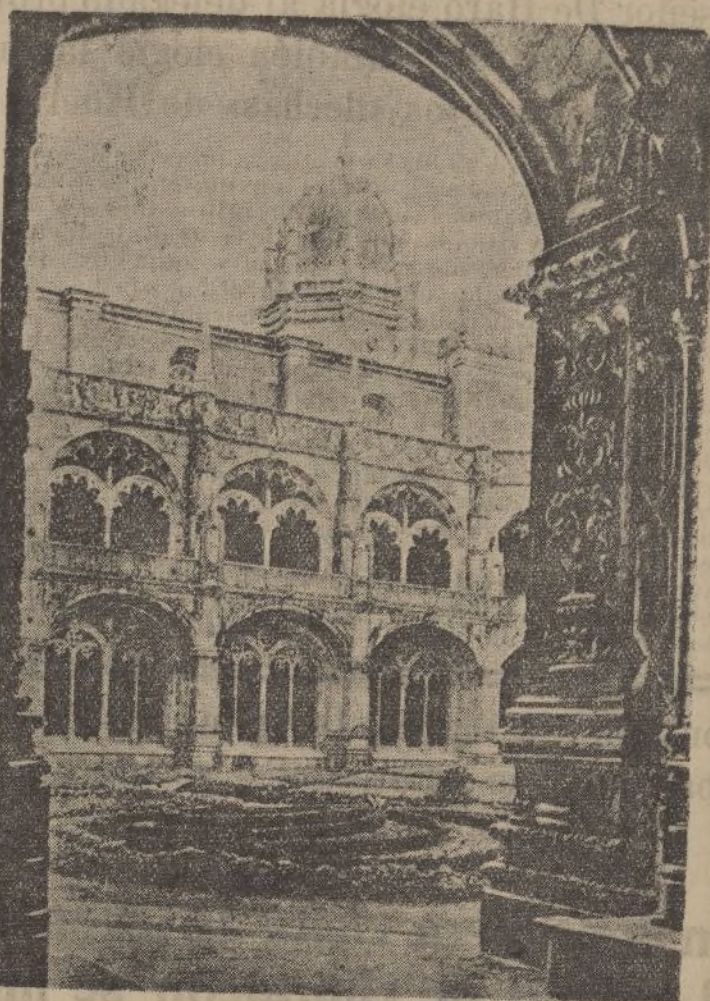
LISBOA.-Claustro gótico Manuelino de los Jerónimos