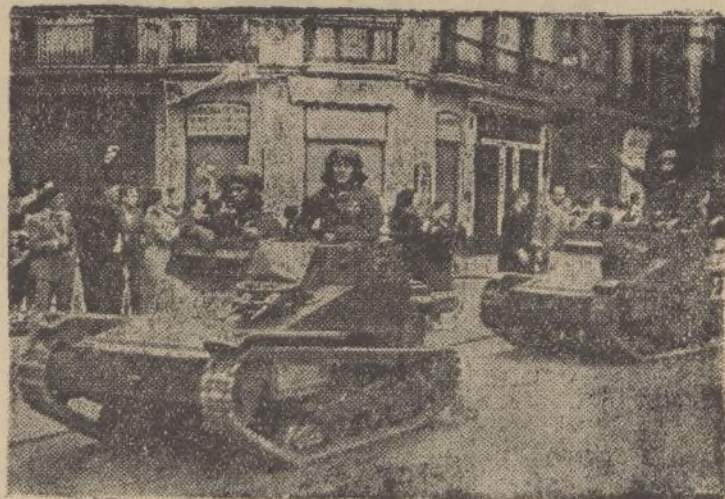
FRENTE DE GUIPÚZCOA.—Tanques ligeros dispuestos para las operaciones.

Castelar, 40. principal, en HUELVA, para más informes.