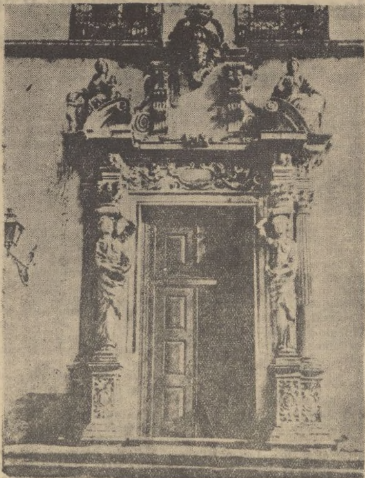
PORTUGAL.—Portada Renacimiento de la Universidad de Coimbra