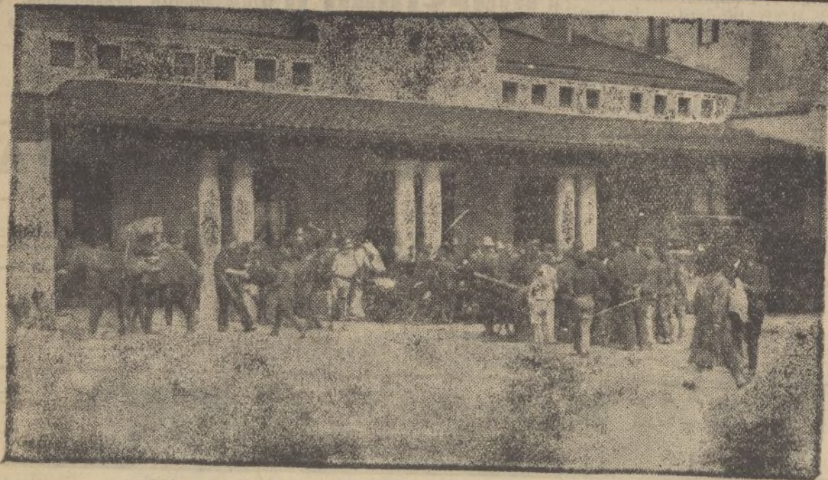
La artillería nacional descansando en Mondragón