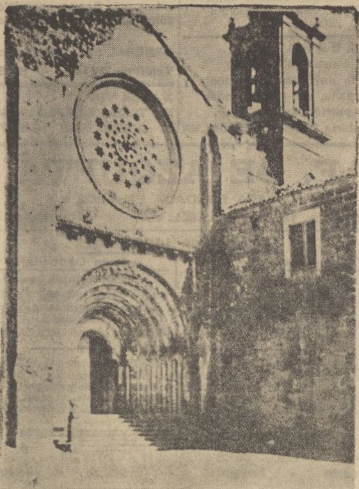
PONTEVEDRA.—Entrada a la iglesia de Armentera