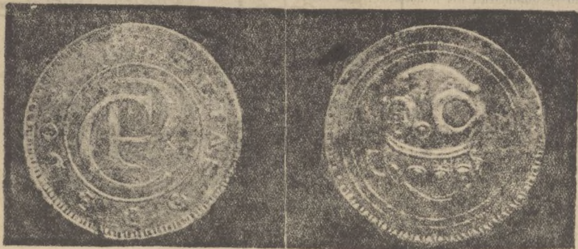
Anverso y reverso de la moneda de dos pesetas, aumentada cuatro veces su tamaño, acuñada por los comunistas en la zona aun no conquistada por el Ejército nacional.