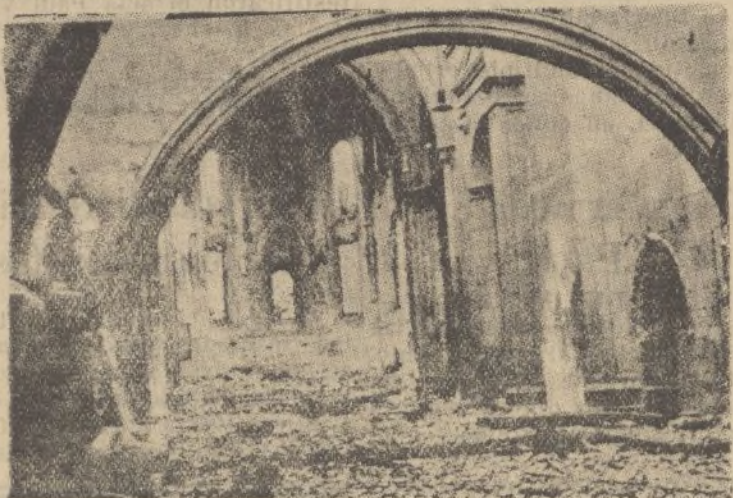
BETANZOS (La Coruña).—Interior de la iglesia conforme quedó después del incendio del día 20 de Julio.

“Vigilad todos el espionaje enemigo. Denunciad y detenec a los traidores”