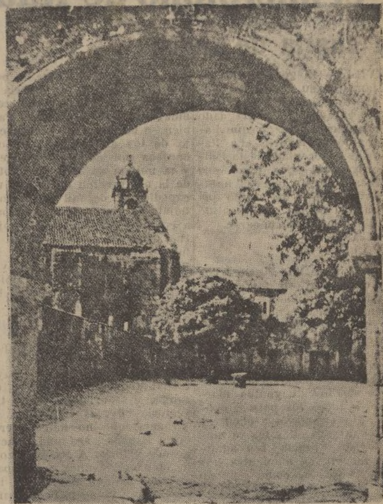
PONTEVEDRA.-Atrio de la iglesia de Armentera

Talleres, 1324 Administración, 1370 Papelería, 1477