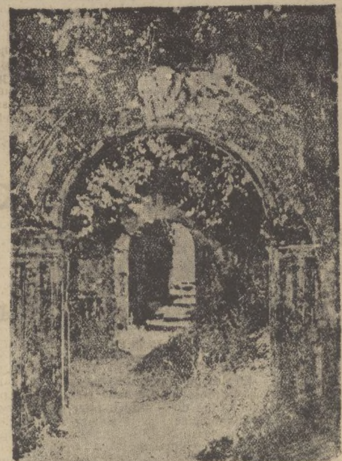
PONTEVEDRA.—Pasadizo en ruinas.