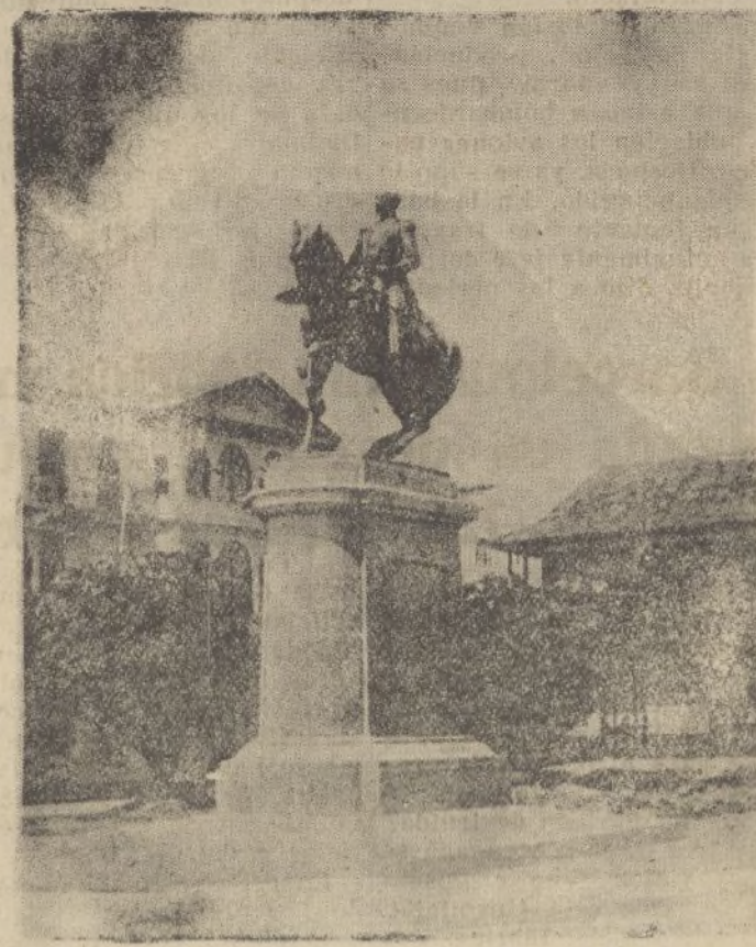
Ciudad-Panamá.—Monumento al General Tomás Herrera. Héroe panameño de los vencedores en Ayacucho