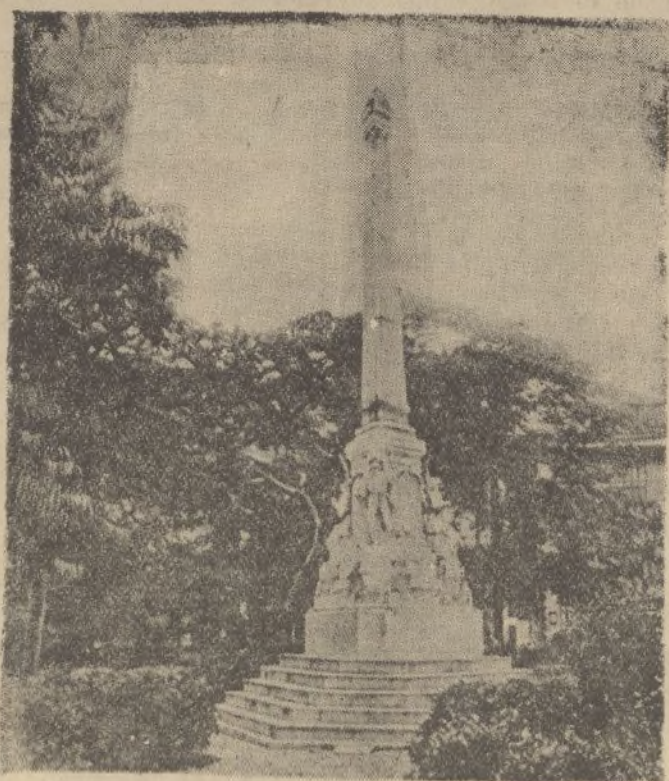
Monumento a los Bomberos.