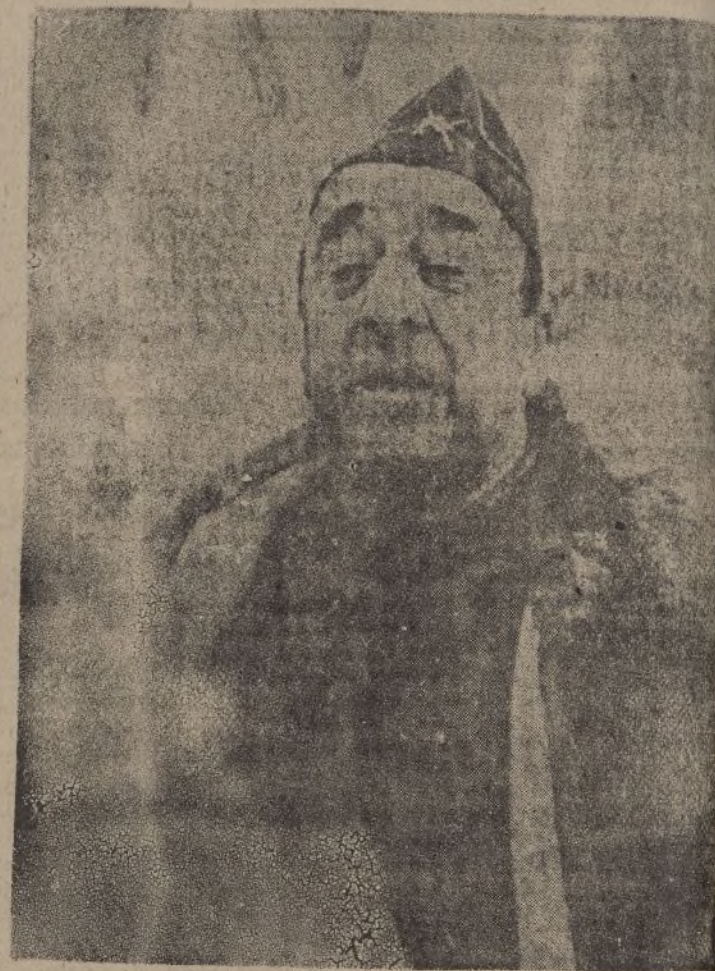
El general Moscardó, héroe del Alcázar

Primero emplearon los marxistas cañones del 7'50, que no hacían más que arañar los muros. Luego del 10,5. Un proyectil de esta clase fué el que derribó la estatua de Carlos V. Finalmente, se empleó la artillería del 15,5. La lluvia de proyectiles fué continua. En días sucesivos van cayendo la fa-