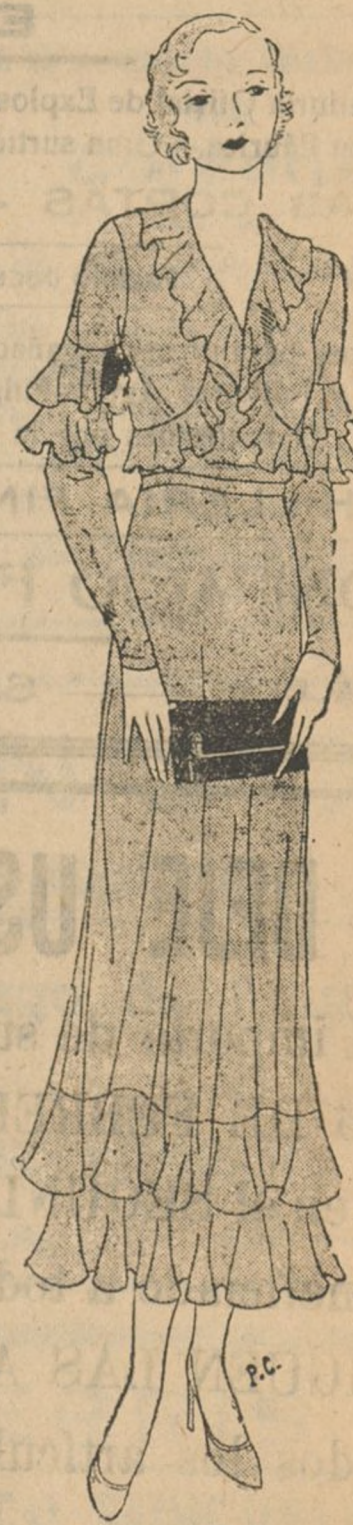
Elegante traje de tarde