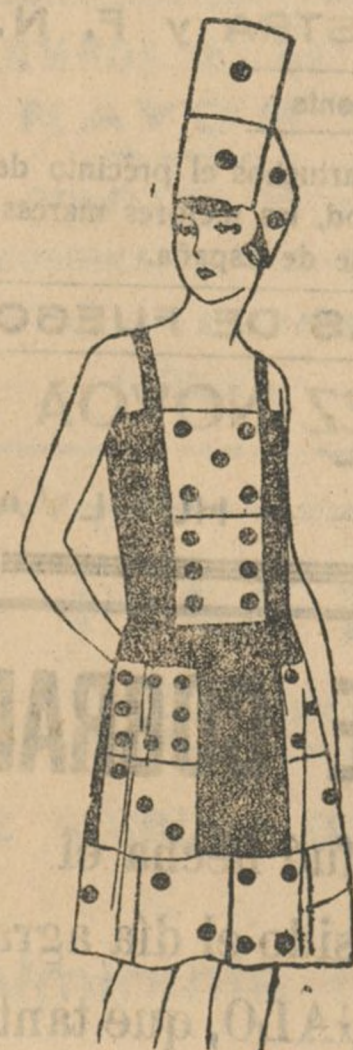
Original y económico traje de máscara para estos días

En los trajes de noche, los corsages, parte importante de las toilettes recientes, son más interesantes por su adorno que por su corte.