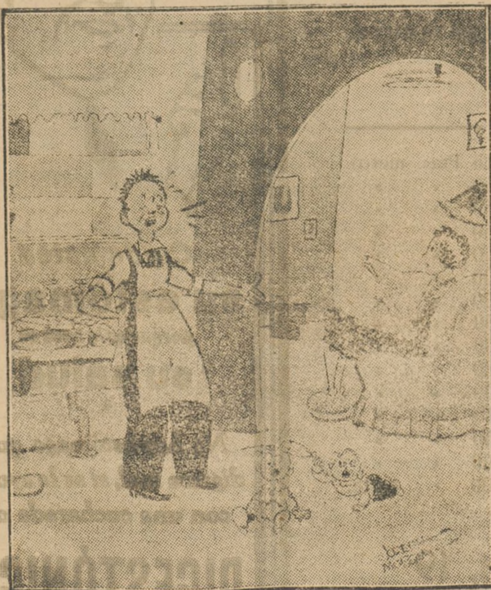
EL HOGAR DE MAÑANA

El Marido: ¡Cuando nos casamos me prometiste que tendríamos criada!