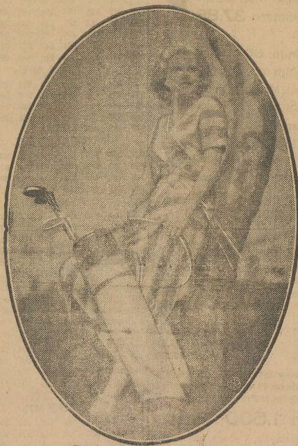
DEPORTES DE HOLLYWOOD

La actriz cinematográfica, Jean Harlow, se ha dedicado con el mayor afán al británico "golf"; deporte que según dice, reúne las mejores condiciones para olvidarse de los ajetreos y pequeñas intrigas características de la Meca cinematográfica.