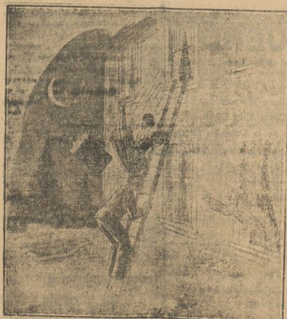
El padre.—¡Ráptela si quiere; pero sin escándalo!