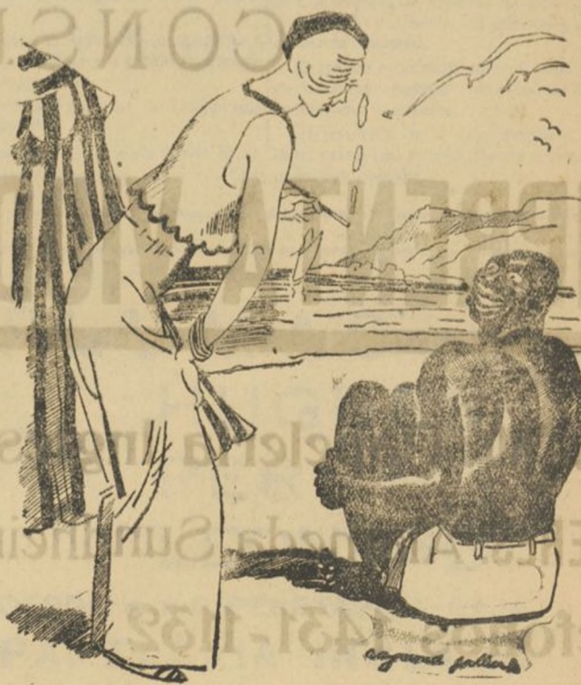
UNA BELLA PIGMENTACION

Amos objetos fueron encontrados en la vía pública.