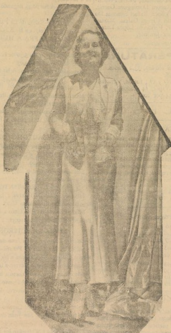
La actriz, Norma Shearer que a su condición de notable y prestigiosa artista de la pantalla une la cualidad de ser admirada como modelo de elegancia y distinción social