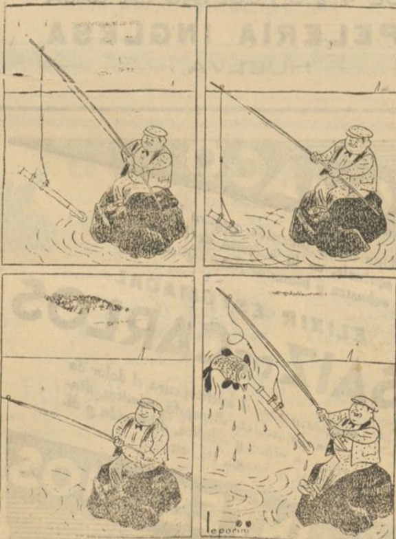
El pescador de pez espada.—El aparejo.