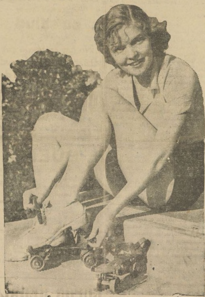
VERNA HILLE, la bella star del cinema ha ganado recientemente el campeonato de patines, en el que tomaron parte numerosas estrellas de Hollywood.